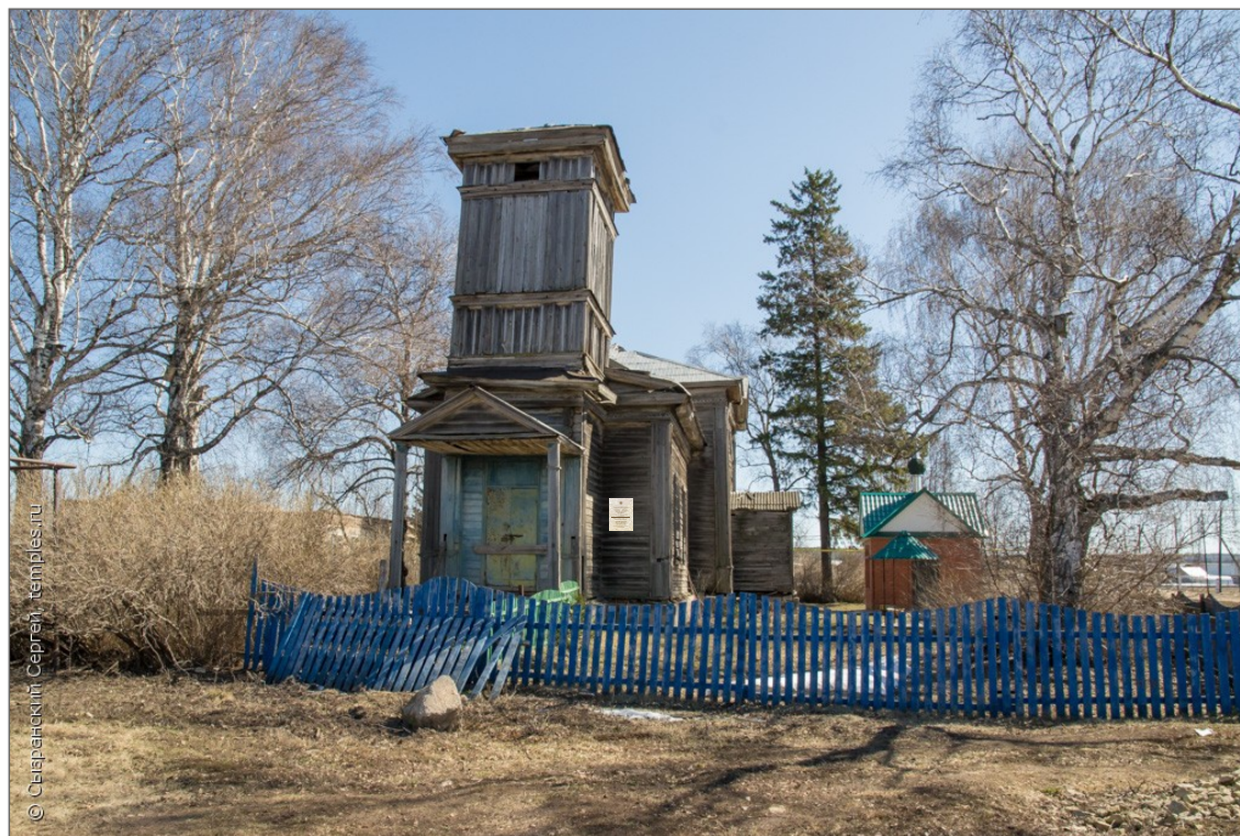
Фотофиксация ОКН с указанием места размещения информационной надписи (фотомонтаж)