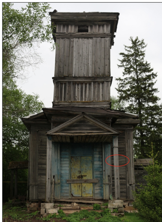
Вид на объект до установки информационной надписи