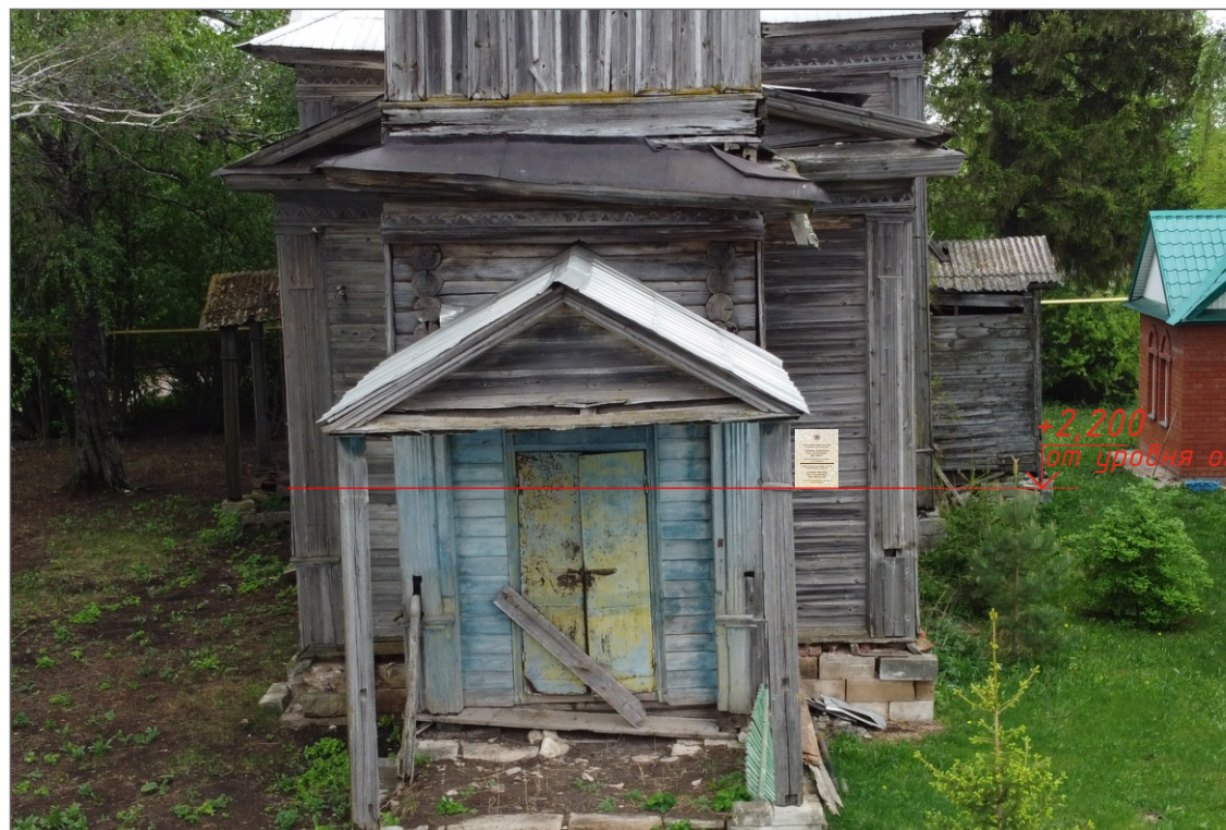
Фотофиксация ОКН с указанием места размещения информационной надписи (фотомонтаж)

установки информационной надписи и обозначений на объекте культурного наследия регионального значения «Троицкая церковь, арх. А.В. Перкиц», 1887-1889 гг., расположенного по адресу: Республика Татарстан, Заинский муниципальный район, с. Верхний Багряж, ул. Советская, д. 7