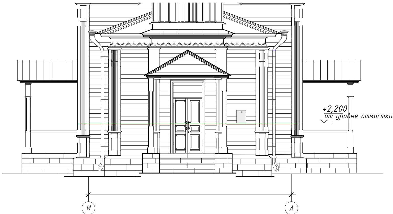
Чертеж с указанием места размещения информационной надписи

установки информационной надписи и обозначений на объекте культурного наследия регионального значения «Троицкая церковь, арх. А.В. Перкиц», 1887-1889 гг., расположенного по адресу: Республика Татарстан, Заинский муниципальный район, с. Верхний Багряж, ул. Советская, д. 7