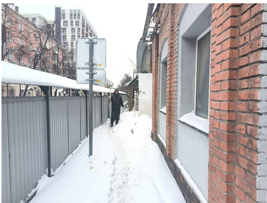
Рис. 9. Типичный ландшафт территории проведения исследований. Общий вид с юга на район западной части площадки проектируемого объекта: «Реконструкция Чеховского рынка по адресу: Республика Татарстан, г Казань, Вахитовский район, ул. Чехова, д. 2, с кадастровым номером: 16:50:011118:39». Точка фотофиксации 5.