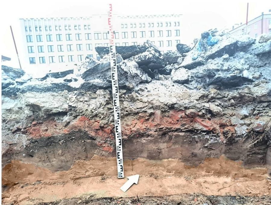
Рис. 13. Зачистка № 1. Северная стенка.