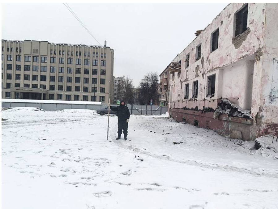
Рис. 7. Типичный ландшафт территории проведения исследований. Общий вид с востока на район центральной части площадки проектируемого объекта: «Реконструкция Чеховского рынка по адресу: Республика Татарстан, г Казань, Вахитовский район, ул. Чехова, д. 2, с кадастровым номером: 16:50:011118:39». Точка фотофиксации 3.