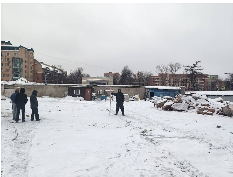
Рис. 6. Типичный ландшафт территории проведения исследований. Общий вид с севера на район южной части площадки проектируемого объекта: «Реконструкция Чеховского рынка по адресу: Республика Татарстан, г Казань, Вахитовский район, ул. Чехова, д. 2, с кадастровым номером: 16:50:011118:39». Точка фотофиксации 2.