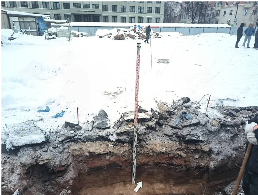
Рис. 14. Зачистка № 1. По завершении работ.