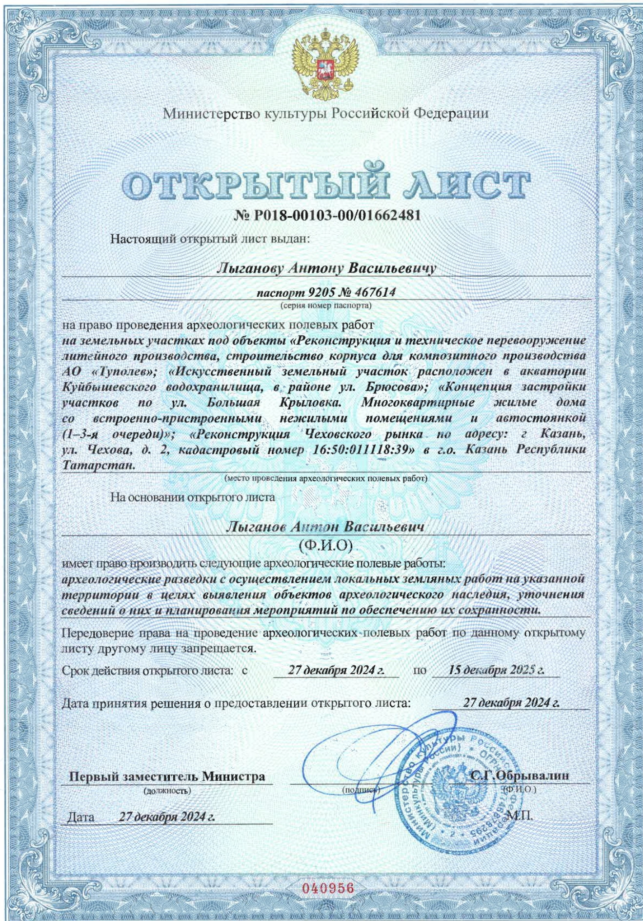
Рис. 15. Копия Открытого листа.