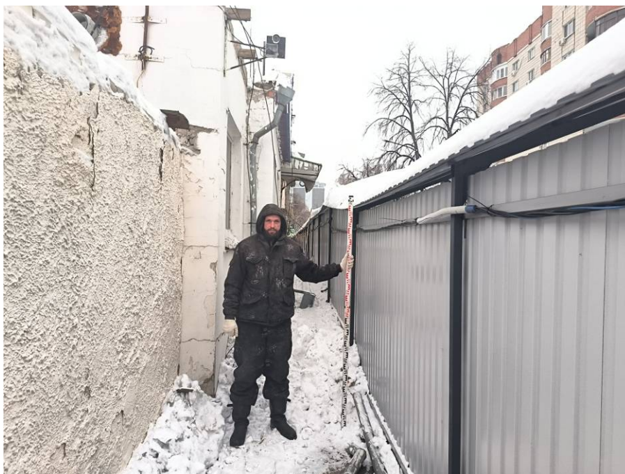
Рис. 8. Типичный ландшафт территории проведения исследований. Общий вид с юга на район восточной части площадки проектируемого объекта: «Реконструкция Чеховского рынка по адресу: Республика Татарстан, г Казань, Вахитовский район, ул. Чехова, д. 2, с кадастровым номером: 16:50:011118:39». Точка фотофиксации 4.