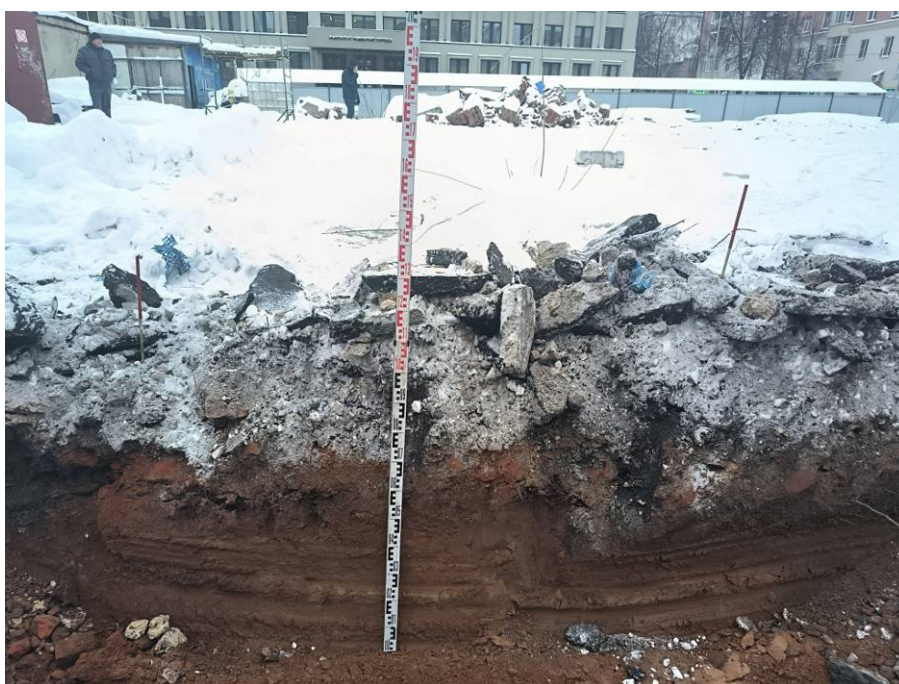
Рис. 12. Зачистка № 1. Место заложения и район юго-восточной части площадки проектируемого объекта, на задернованной водораздельной поверхности. Вид с юга.