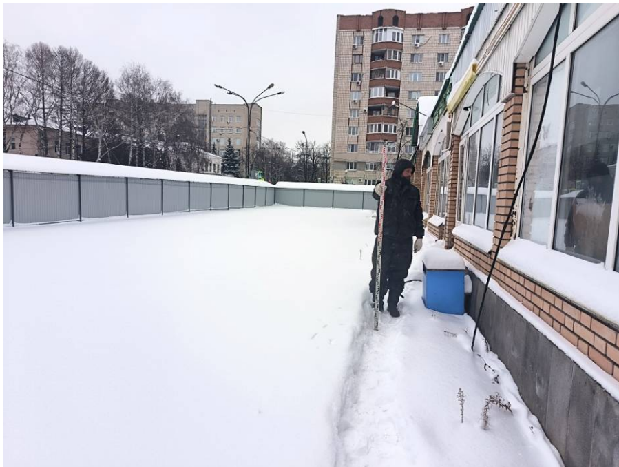
Рис. 11. Типичный ландшафт территории проведения исследований. Общий вид с запада на район северной части площадки проектируемого объекта: «Реконструкция Чеховского рынка по адресу: Республика Татарстан, г Казань, Вахитовский район, ул. Чехова, д. 2, с кадастровым номером: 16:50:011118:39». Точка фотофиксации 7.