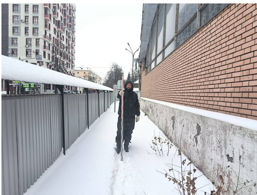
Рис. 10. Типичный ландшафт территории проведения исследований. Общий вид с юга на район северной части площадки проектируемого объекта: «Реконструкция Чеховского рынка по адресу: Республика Татарстан, г Казань, Вахитовский район, ул. Чехова, д. 2, с кадастровым номером: 16:50:011118:39». Точка фотофиксации 6.