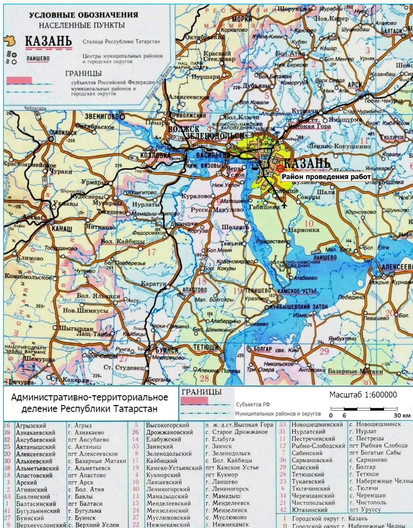
Рис. 1. Район работ по объекту: «Реконструкция Чеховского рынка по адресу: Республика Татарстан, г Казань, Вахитовский район, ул. Чехова, д. 2, с кадастровым номером: 16:50:011118:39» в городском округе Казань (№1) РТ.