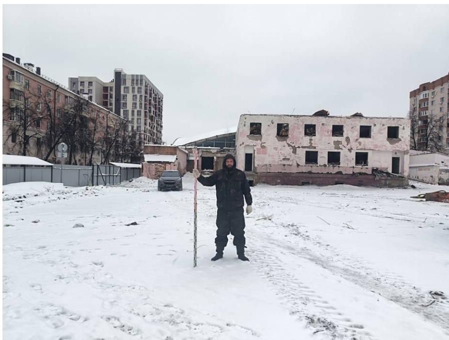
Рис. 5. Типичный ландшафт территории проведения исследований. Общий вид с юга на район западной части площадки проектируемого объекта: «Реконструкция Чеховского рынка по адресу: Республика Татарстан, г Казань, Вахитовский район, ул. Чехова, д. 2, с кадастровым номером: 16:50:011118:39». Точка фотофиксации 1.