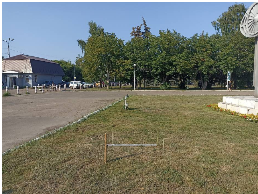
Рис. 7. Шурф № 1. Место заложения и район проектируемого объекта, на задернованной водораздельной поверхности. Вид с юга.