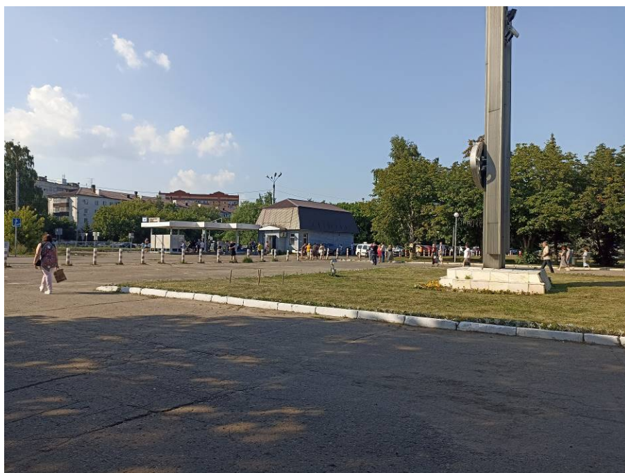
Рис. 5. Типичный ландшафт территории проведения исследований. Вид с юга на район объекта: «Элементы благоустройства площади имени А.Ф. Павлова с установкой скульптурно-архитектурного ансамбля». Точка фотофиксации №2.