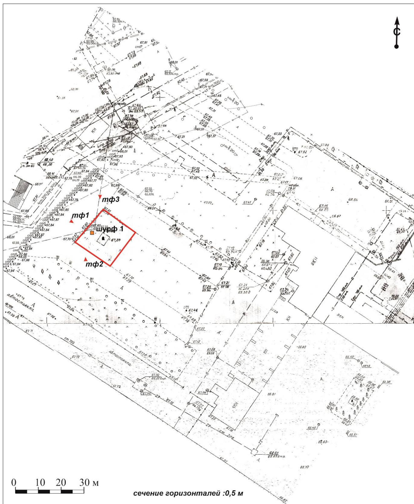
Рис. 3. Участок работ по объекту: «Элементы благоустройства площади имени А.Ф. Павлова с установкой скульптурно-архитектурного ансамбля» разведочного шурфа и точек фотофиксации.