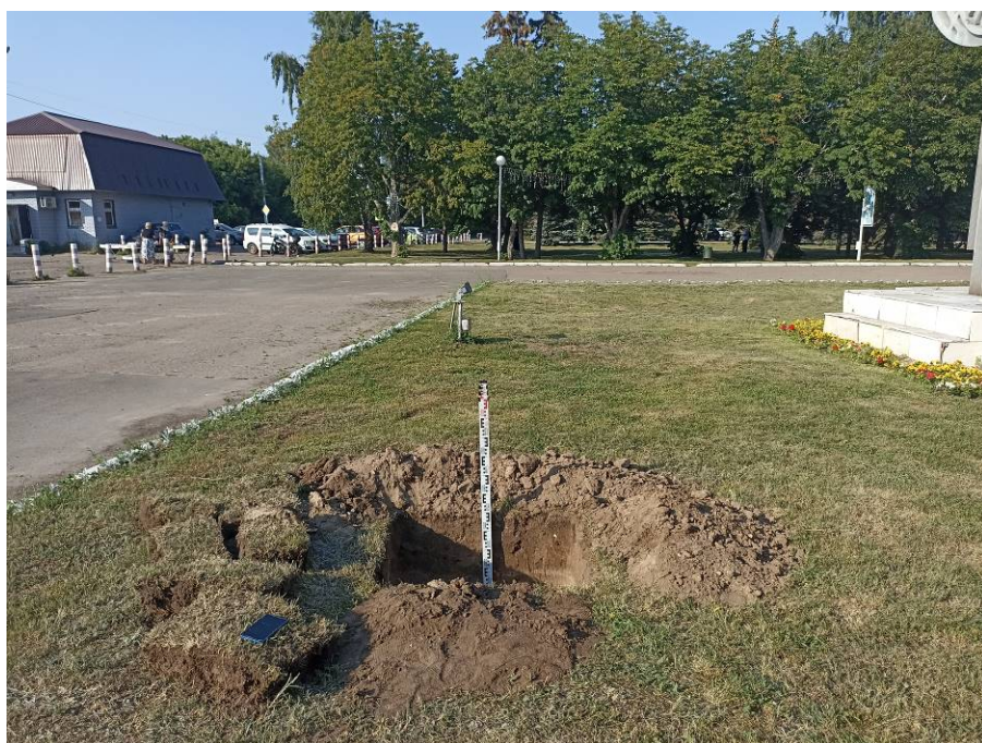
Рис. 9. Шурф № 1. По завершении работ.