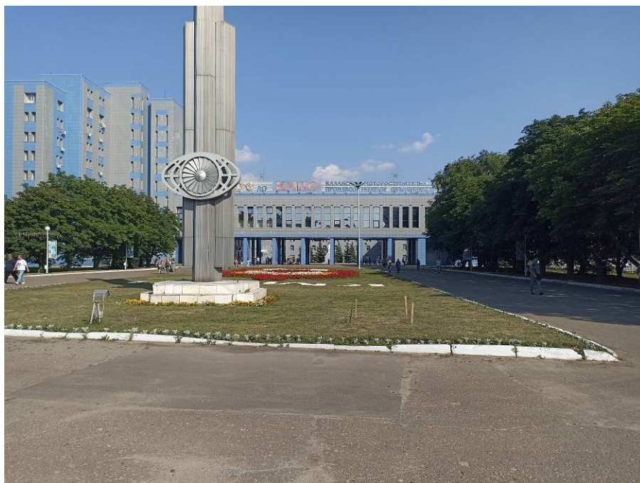
Рис. 4. Типичный ландшафт территории проведения исследований. Общий вид с северо-востока на район объекта: «Элементы благоустройства площади имени А.Ф. Павлова с установкой скульптурно-архитектурного ансамбля». Точка фотофиксации №1.