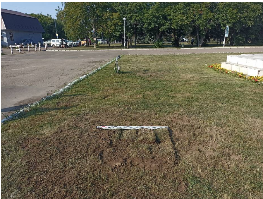
Рис. 10. Шурф № 1. После рекультивации.