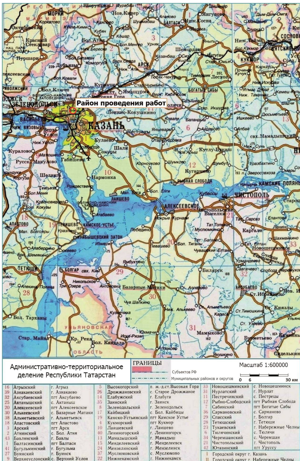
Рис. 1. Район работ по объекту: «Элементы благоустройства площади имени А.Ф. Павлова с установкой скульптурно-архитектурного ансамбля» в городском округе г. Казань (№I) РТ.