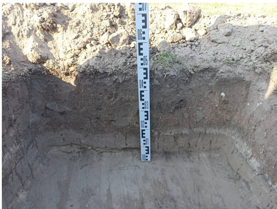
Рис. 8. Шурф № 1. Северная стенка и поверхность материка.