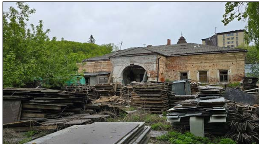
«Дом жилой», конец XVII – начало XVIII вв. ул. Старая, 4