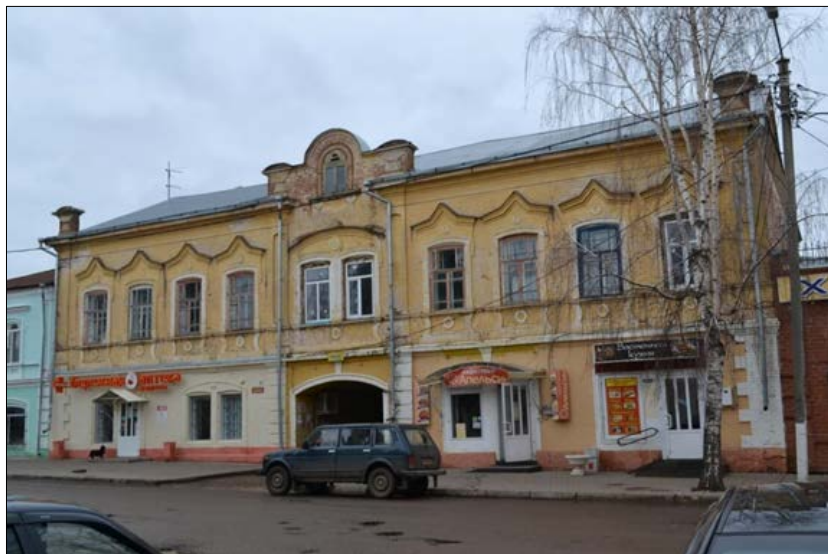
«Двухэтажный кирпичный жилой дом с лавками и проездной аркой», конец XIX в. ул. Ленина, 48 А,А1,А2,А3