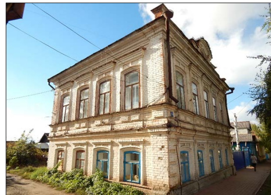
«Дом, где жили Л.М. Леонов, И. Сельвинский» ул. Карла Маркса, 22А