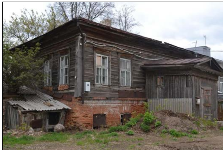
«Жилой дом», начало XX в. ул. Карла Маркса, 66А