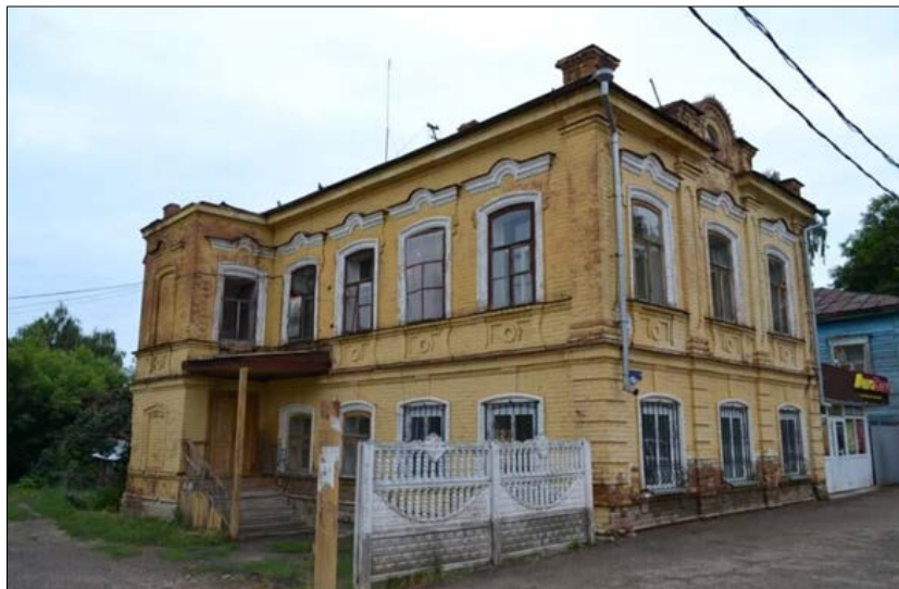
«Жилой дом», сер. XIX в. ул. Бебеля, 126Б