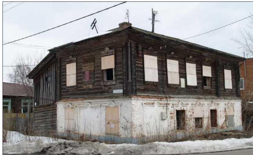
«Дом жилой», конец XIX в. ул. 10 лет Татарстана, 12