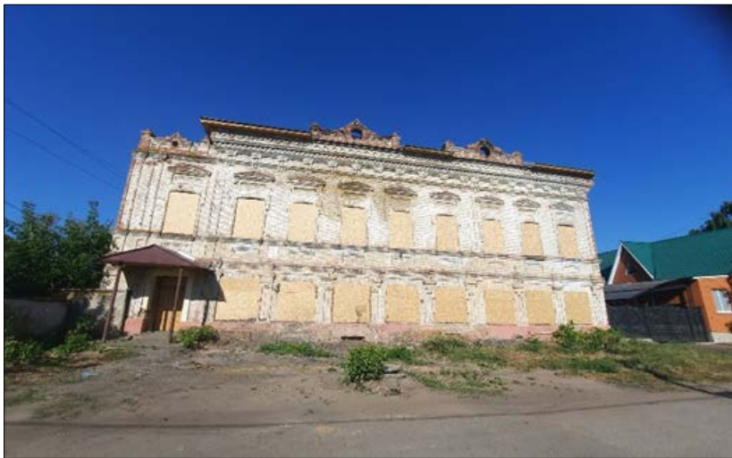
«Здание клуба банковских и торговых работников», конец XIX в. ул. 10 лет Татарстана, 9