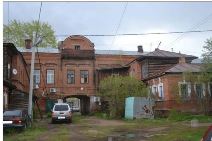
«Дом С.М. Кирпичникова», конец XIX в. ул. Ленина, 32 Б,В,Е