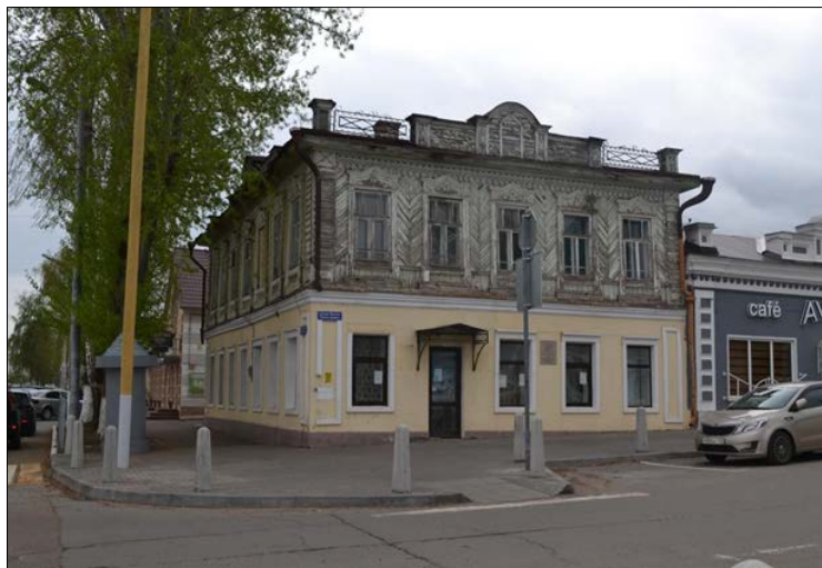
«Усадебный комплекс Житковых», XIX в. ул. Ленина, 37А