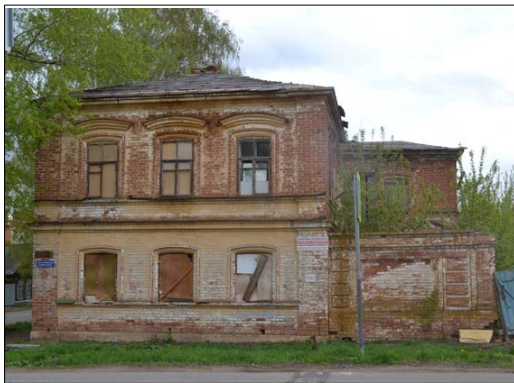
«Двухэтажный кирпичный жилой дом с оградой и верандой», конец XIX в. ул. Октябрьская, 81 А-А1