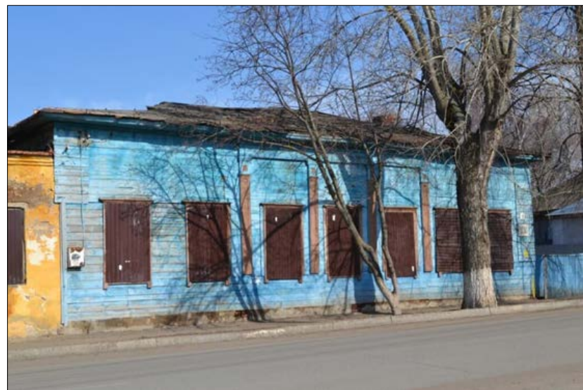
«Жилой дом», сер. XIX в. ул. Ленина, 79 А-А2