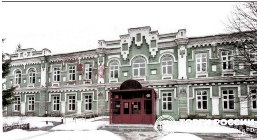
«Административное здание», конец XIX – начало XX вв. ул. 25-го Октября, 5