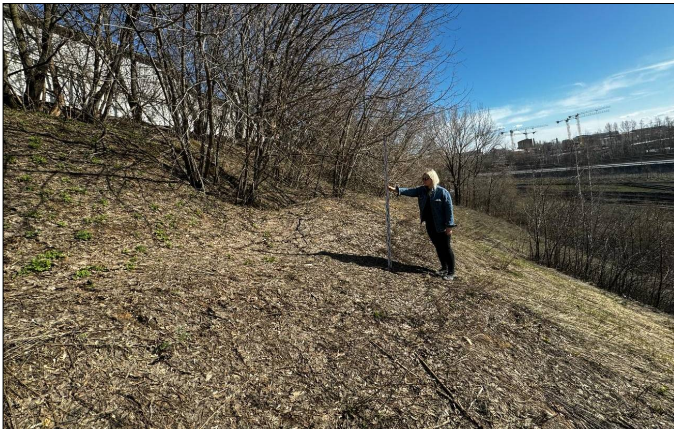
Рис. 15 РТ, Кировский район, г. Казань Архангельский переулок 1, т.ф. №9 общий вид с севера «Зилантовское селище» XIII-XIV вв.