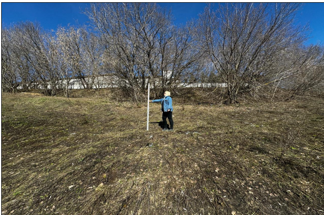
Рис. 14 РТ, Кировский район, г.Казань Архангельский переулок 1, т.ф.№8 общий вид с запада на «Зилантовское селище», XIII-XIV вв.