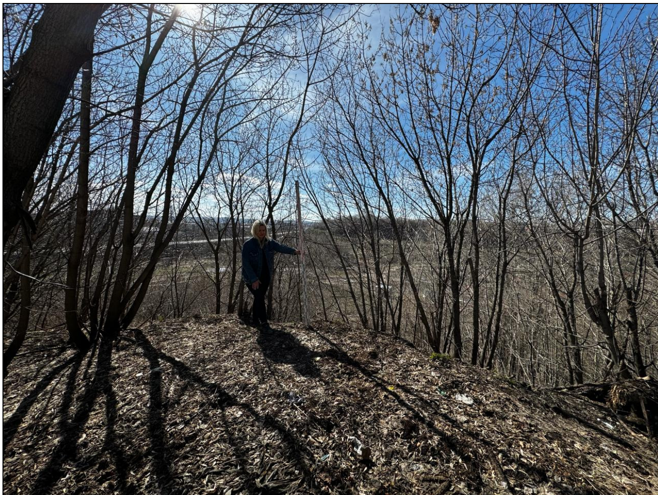
Рис. 11 РТ, Кировский район, г.Казань Архангельский п. 1, т.ф.№5 вид с востока на поворотную точку №1 «Селище или городище «Зилантова гора», XIII-XIV вв.