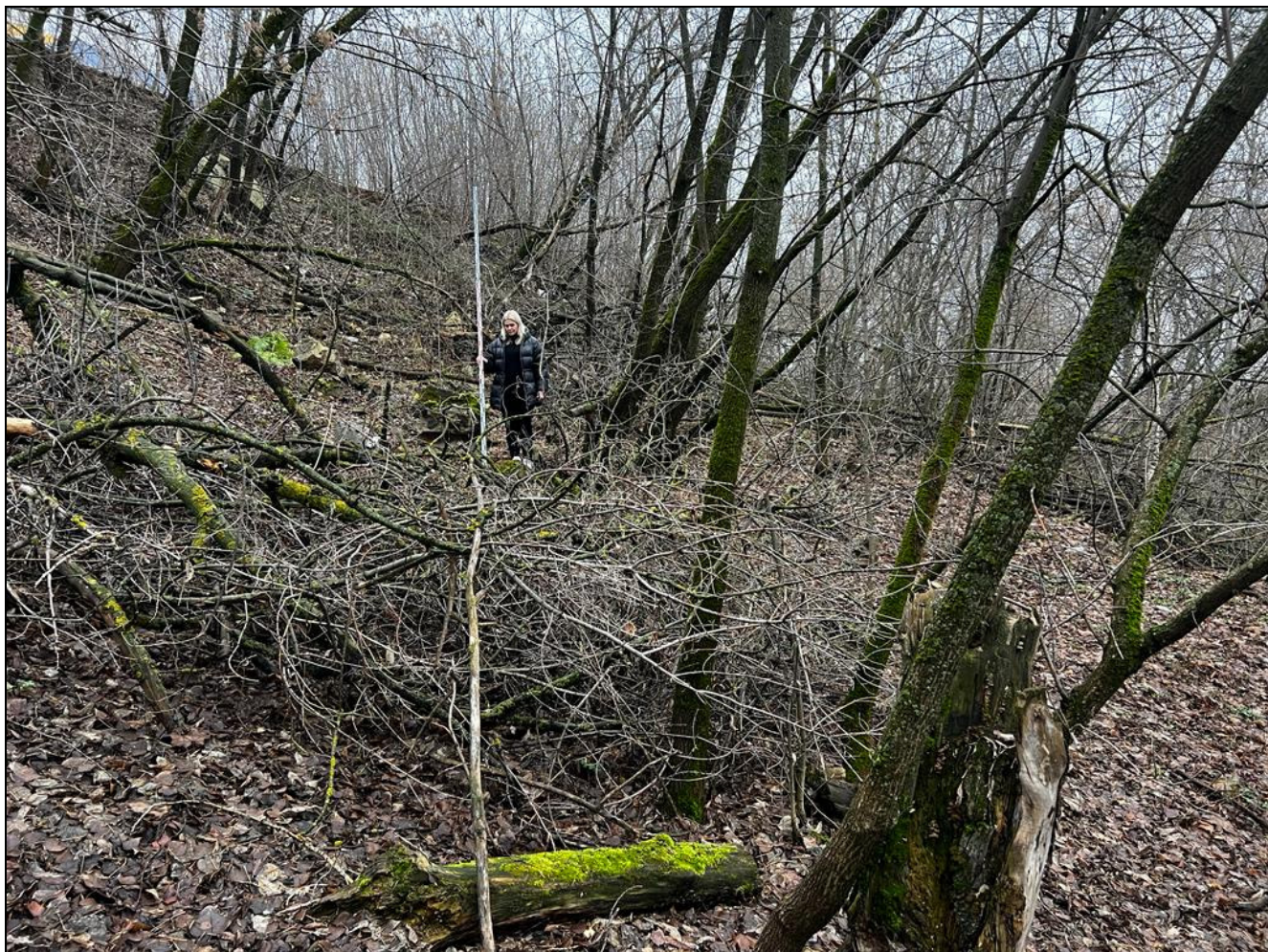
Рис. 9 РТ, Кировский район, г.Казань Архангельский переулоч 1, т.ф.№3 общий вид с северо-востока на «Селище или городище «Зилантова гора», XIII-XIV вв.