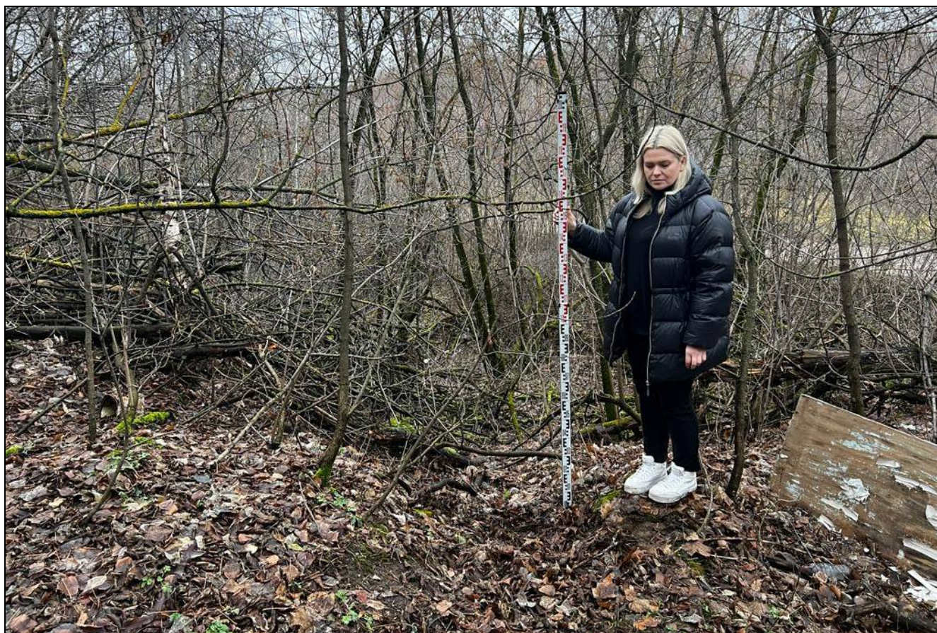
Рис.8 РТ, Кировский район, г.Казань Архангельский переулоч 1, т.ф.№2 вид с юга верх склона «Селище или городище «Зилантова гора», XIII-XIV вв.