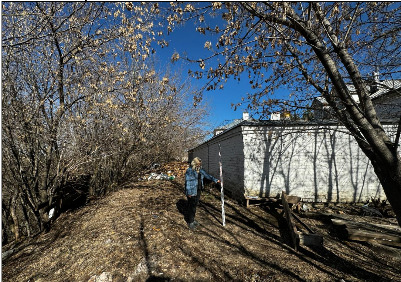
Рис. 12 РТ, Кировский район, г.Казань Архангельский переулок.1, т.ф.№6 общий вид с запада на верх склона «Селище или городище «Зилантова гора» XIII-XIV вв.