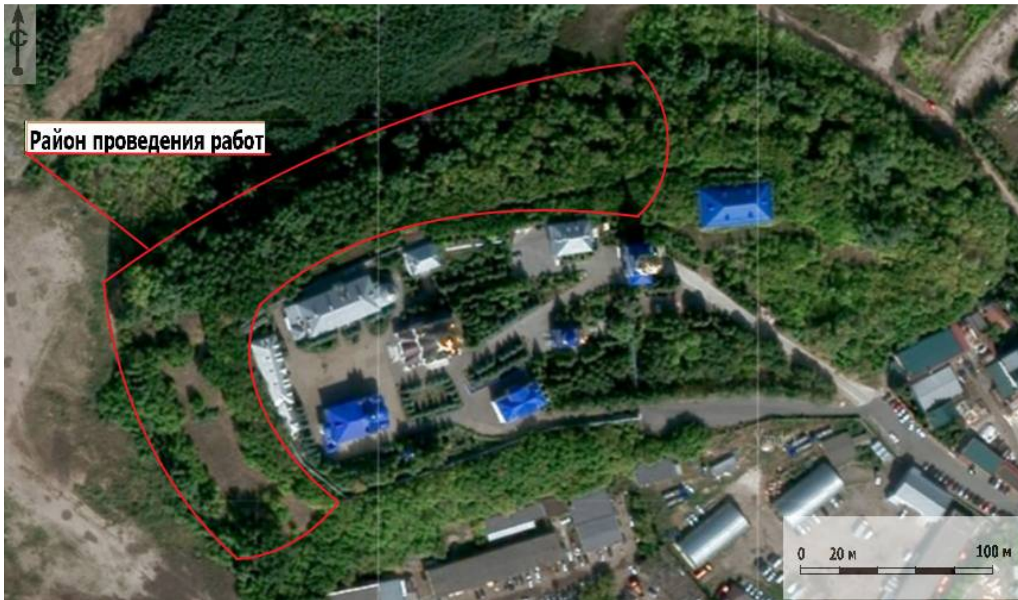
Рис.6 Аэрофотоснимок с обозначением границ участка проектируемых работ.