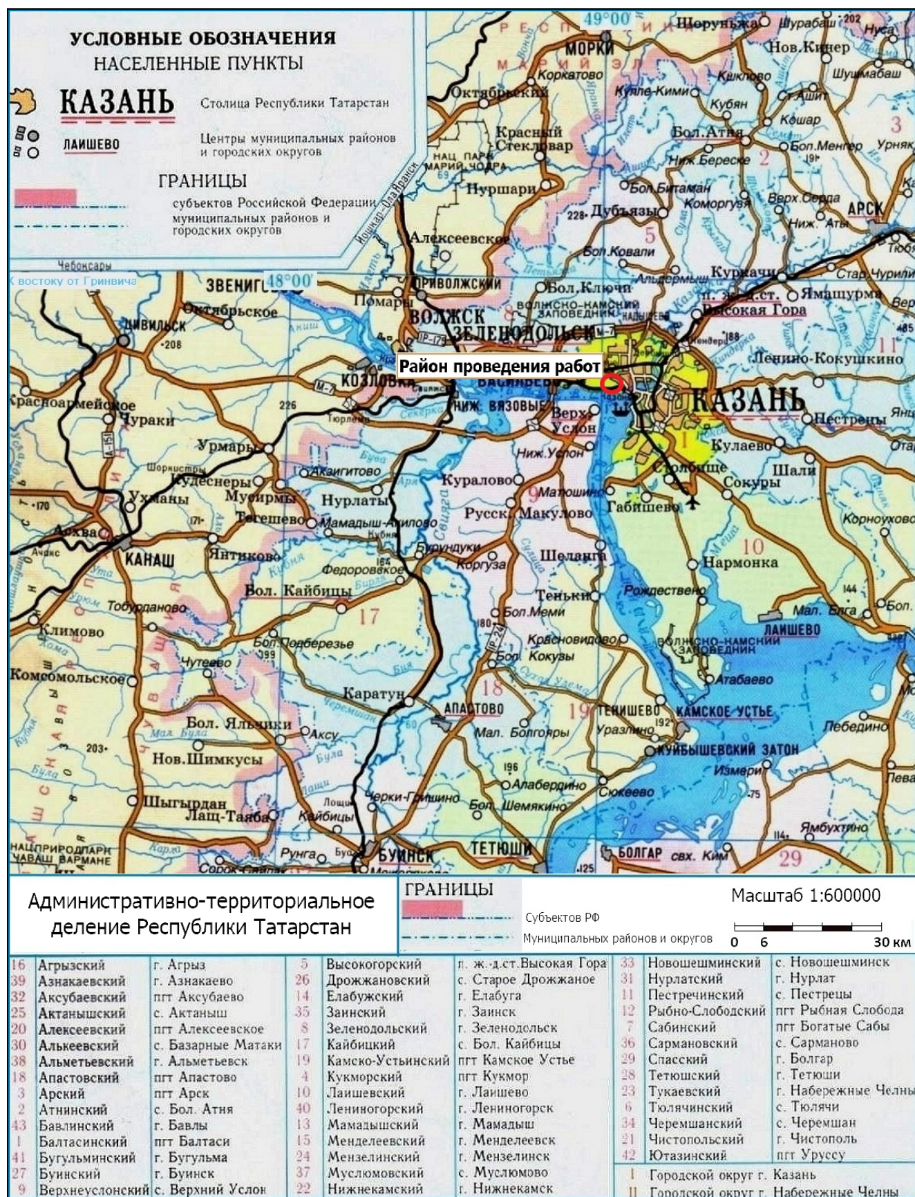
Рис. 1 Районы работ по объекту: «Укрепление склона на территории объекта «Успенский Зилантов женский монастырь», расположенного по адресу: г. Казань, пер. Архангельский, д. 1» на карте муниципальных районов Республики Татарстан в городском округе Казань Республики Татарстан.