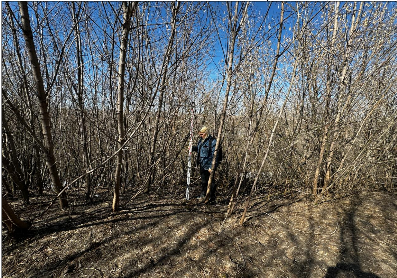
Рис. 10 РТ, Кировский район, г.Казань Архангельский переулоч 1, т.ф.№4 общий вид с юга на поворотную точку №2 верх склона «Селище или городище «Зилантова гора», XIII-XIV вв.