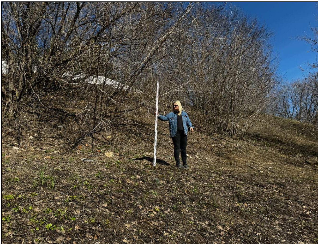
Рис. 13 РТ, Кировский район, г.Казань Архангельский переулок 1, т.ф.№7 общий вид с северо-запада на «Зилантовское селище», XIII-XIV вв.