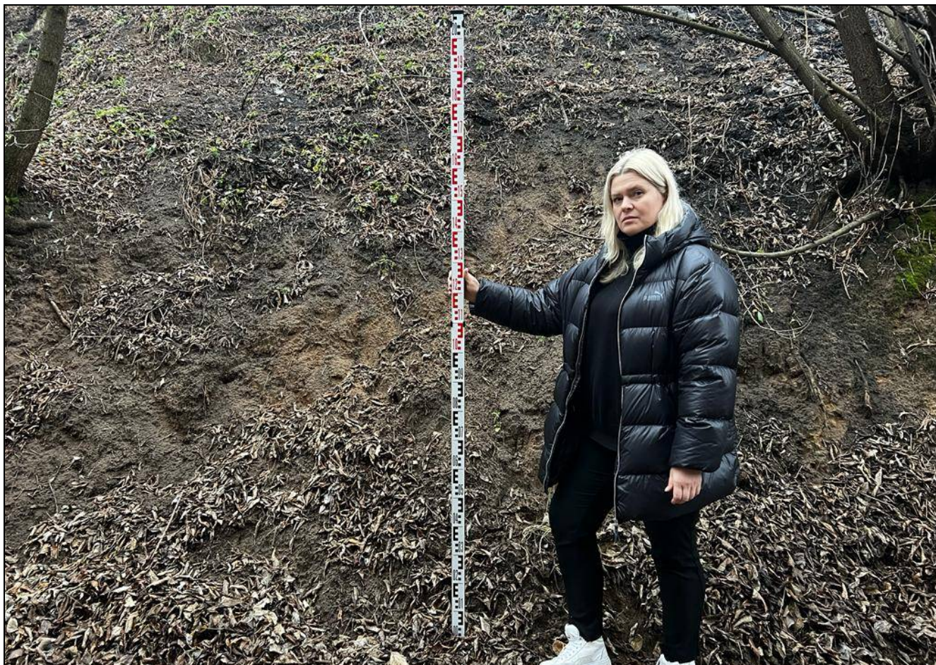
Рис. 7 РТ, Кировский район, г.Казань Архангельский переулоч 1, т.ф.№1 общий вид с севера у подножья склона «Селище или городище «Зилантова гора», XIII-XIV вв.