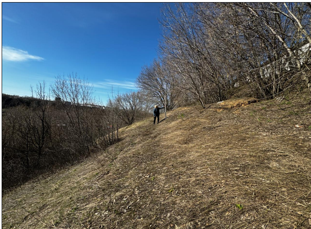
Рис. 16 РТ, Кировский район, г.Казань Архангельский переулок 1, т.ф. №10 общий вид с юга на «Зилантовское селище» XIII-XIV вв.