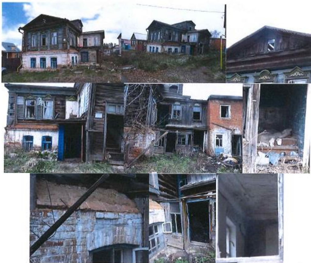
25. Полукаменный жилой дом с верандой, конец XIX в. г. Чистополь, ул. Г. Тукая, д. 15, лит. А, Б

Градостроительные характеристики: не является градоформирующим, расположен на отдалении от центральной части исторического центра;