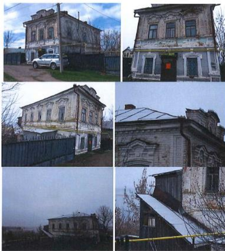
24. Жилой дом, сер. XIX в. г. Чистополь, ул. Маркина, д. 16, лит. Б

Градостроительные характеристики: расположен на подъездной магистрали в исторической центр города, формирует облик важной городской артерии;