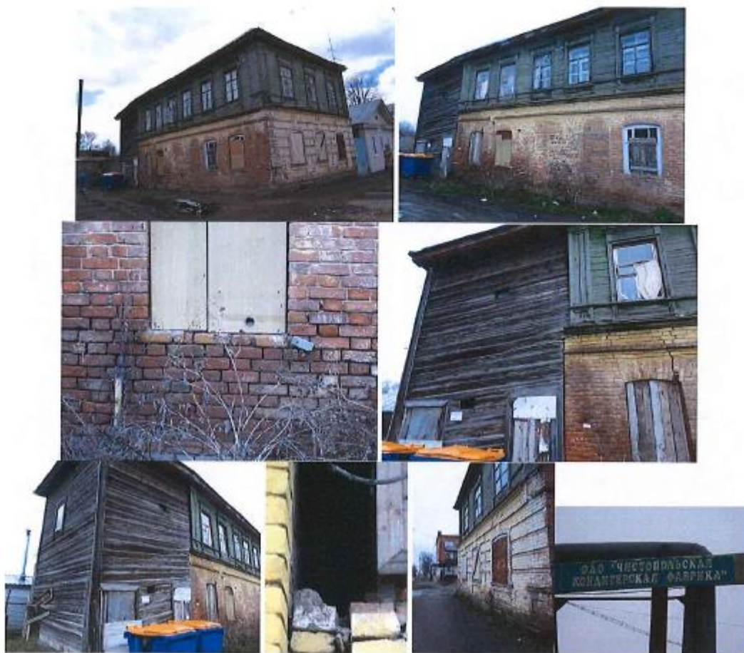
29. Полукаменный двухэтажный жилой дом, начало XIX в. г. Чистополь, ул. Урицкого, д. 69, лит. Б

Градостроительные характеристики: Здание расположено по красной линии улицы Нариманова, напротив исторической чистопольской кондитерской фабрики, формирует фронт застройки улицы;