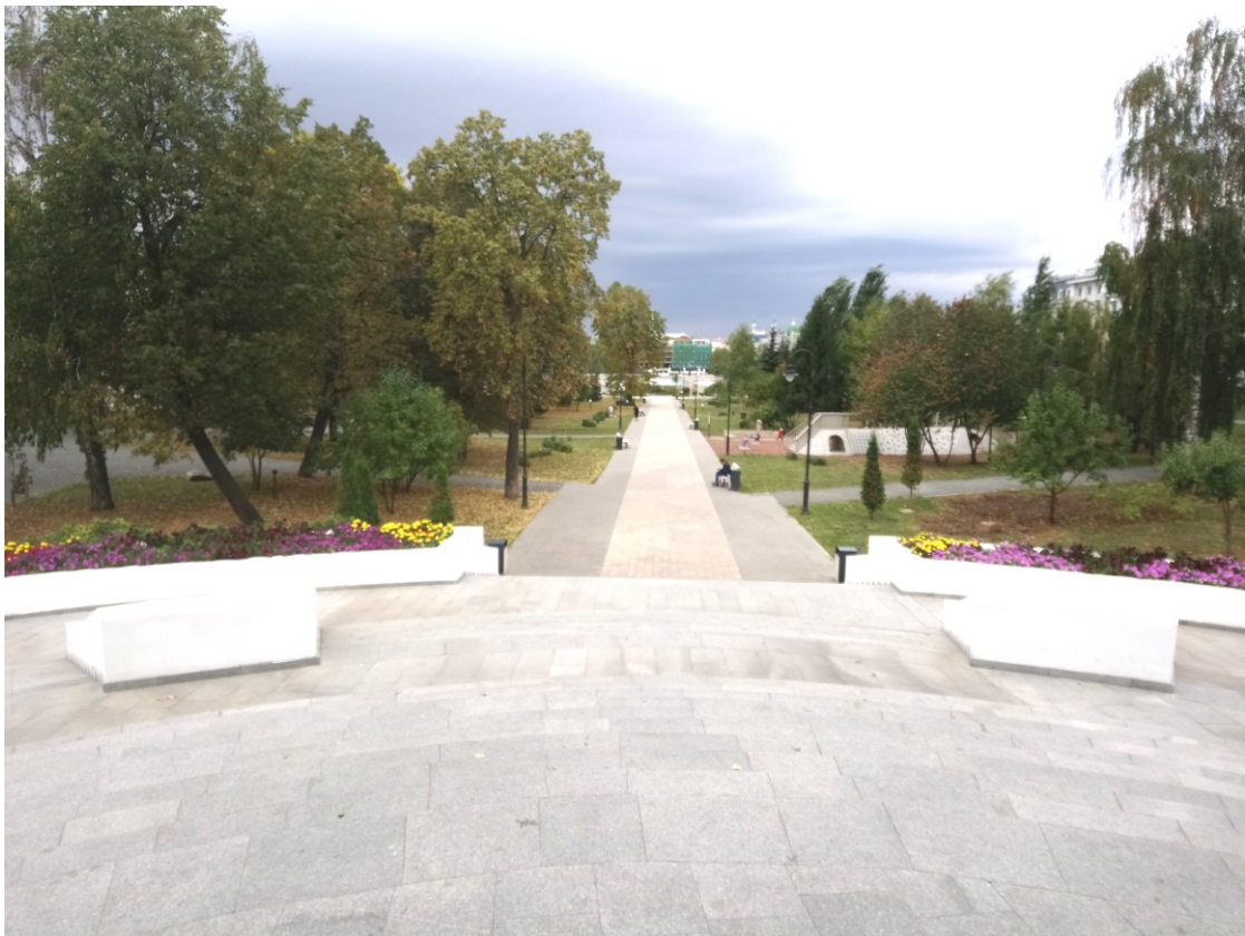
Фото 4. Центральная аллея.