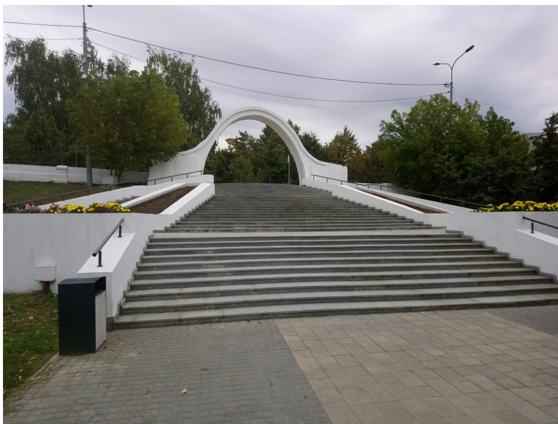
Фото 2. Лестница у входа в парк.