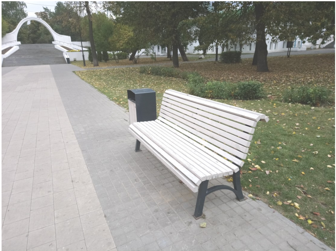
Фото 7. Скамейка.