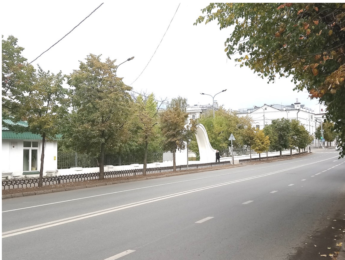
Фото 1. Вход в парк со стороны ул. Лобачевского.