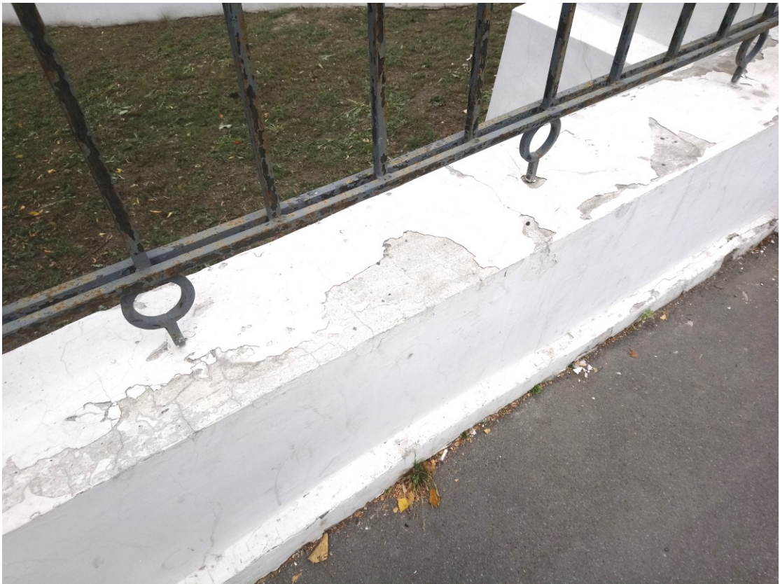
Фото 3. Фрагмент ограды вдоль границы объекта.