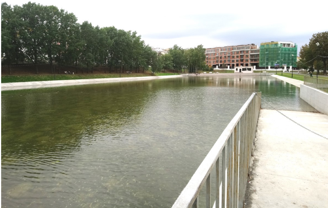
Фото 9. Водоем.