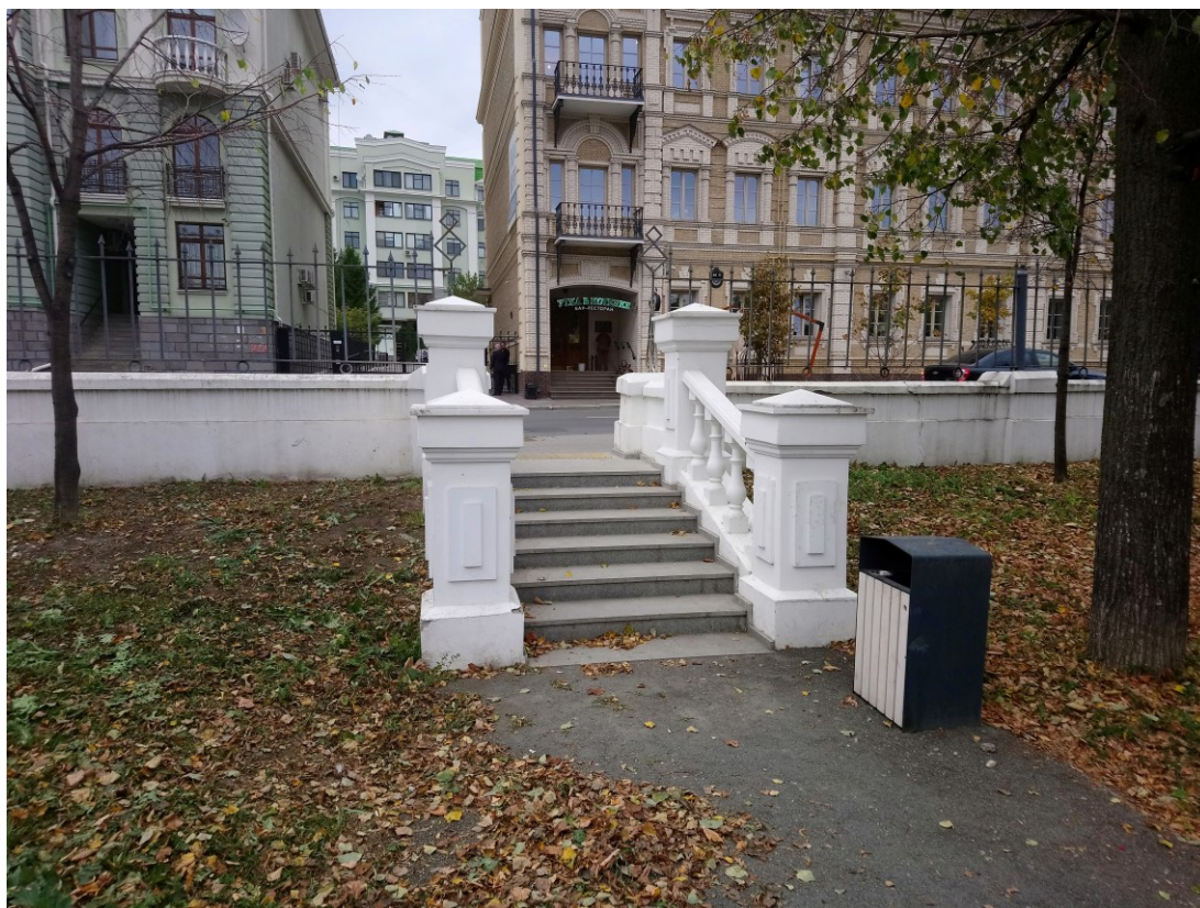
Фото 6. Вход в парк со стороны ул. Держинского.