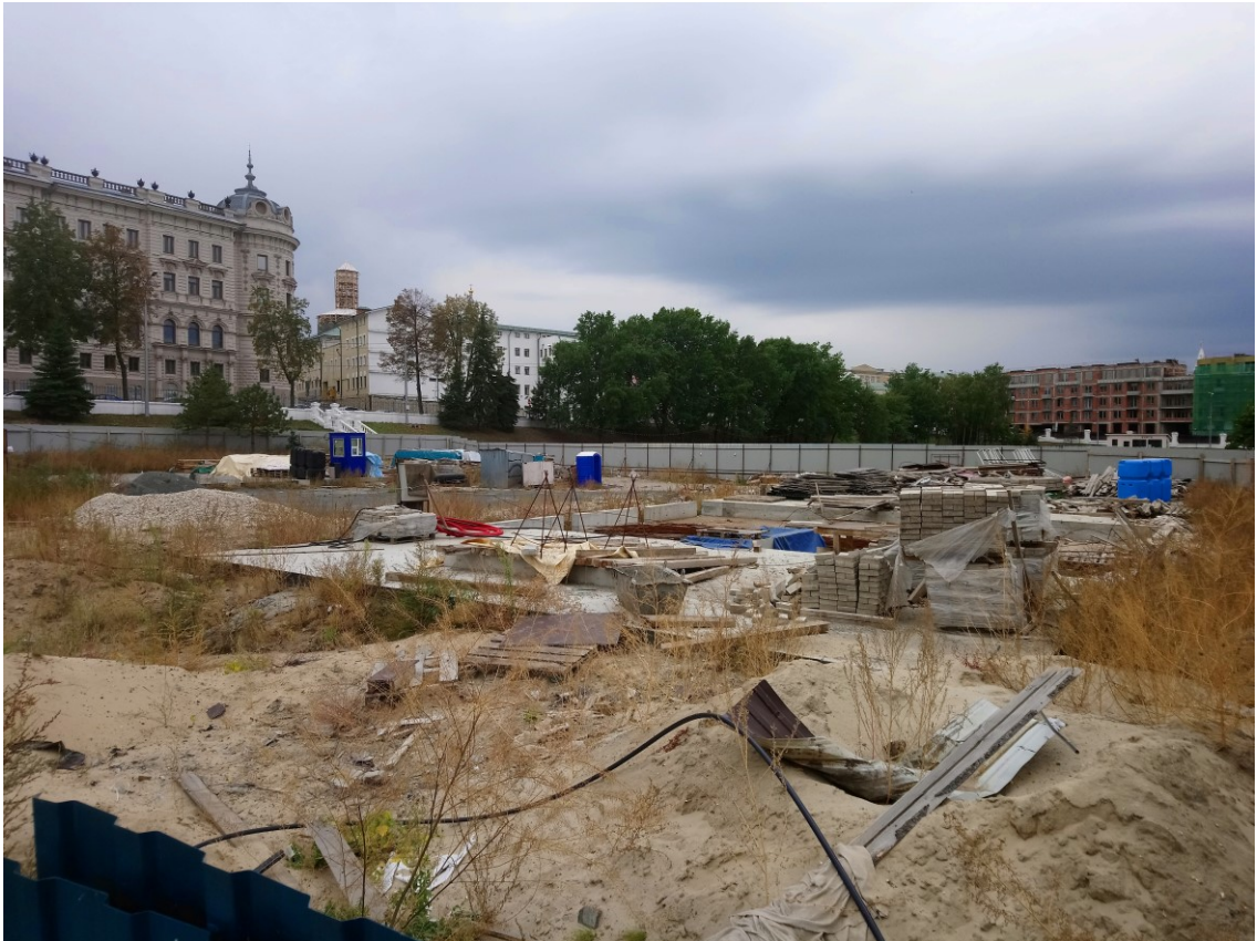
Фото 12. Строительные работы в границах парка.