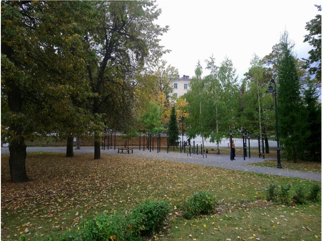
Фото 11. Тренировочная площадка.