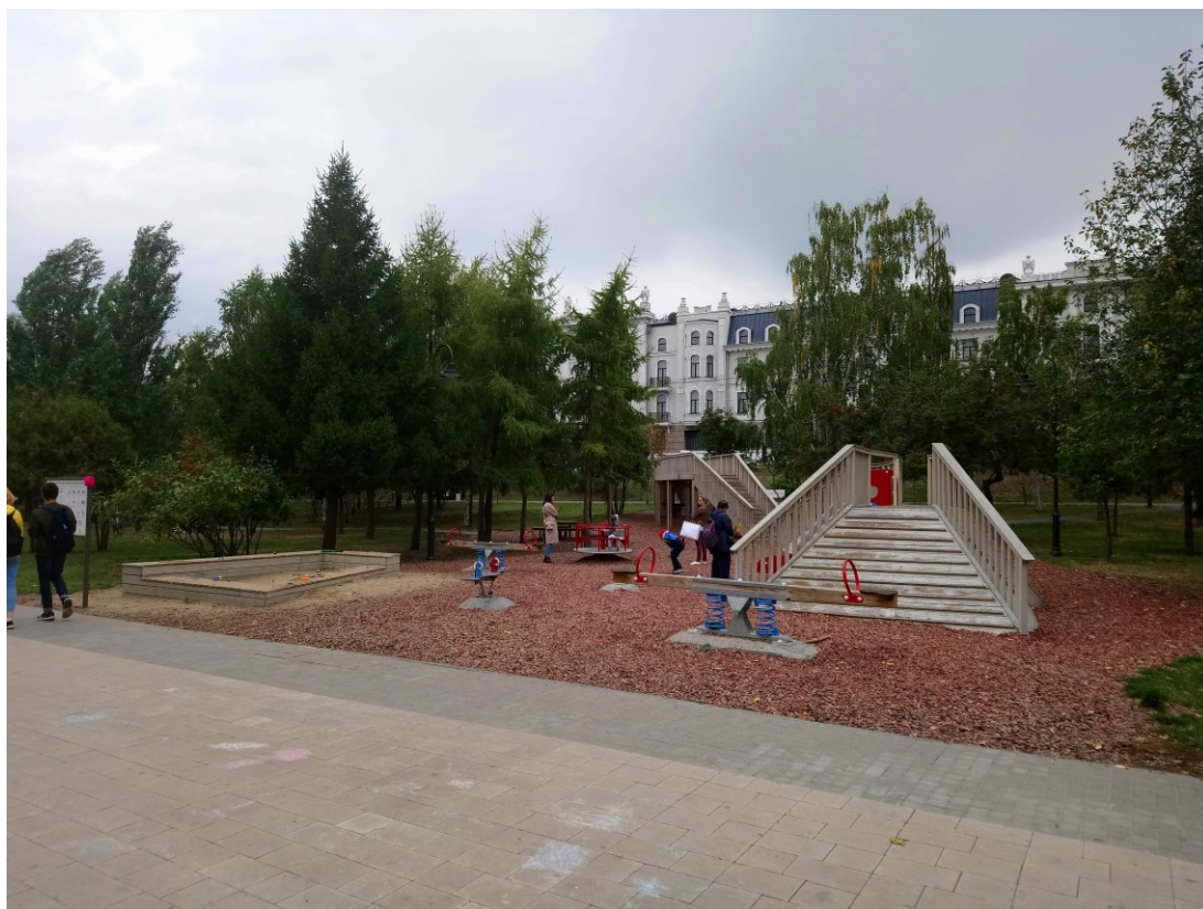
Фото 5. Детская площадка.