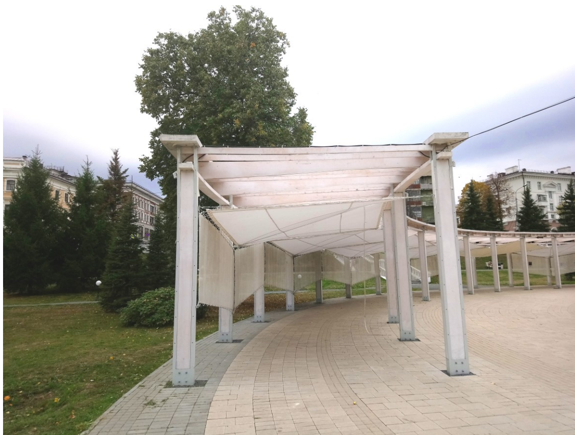
Фото 10. Малые архитектурные формы.