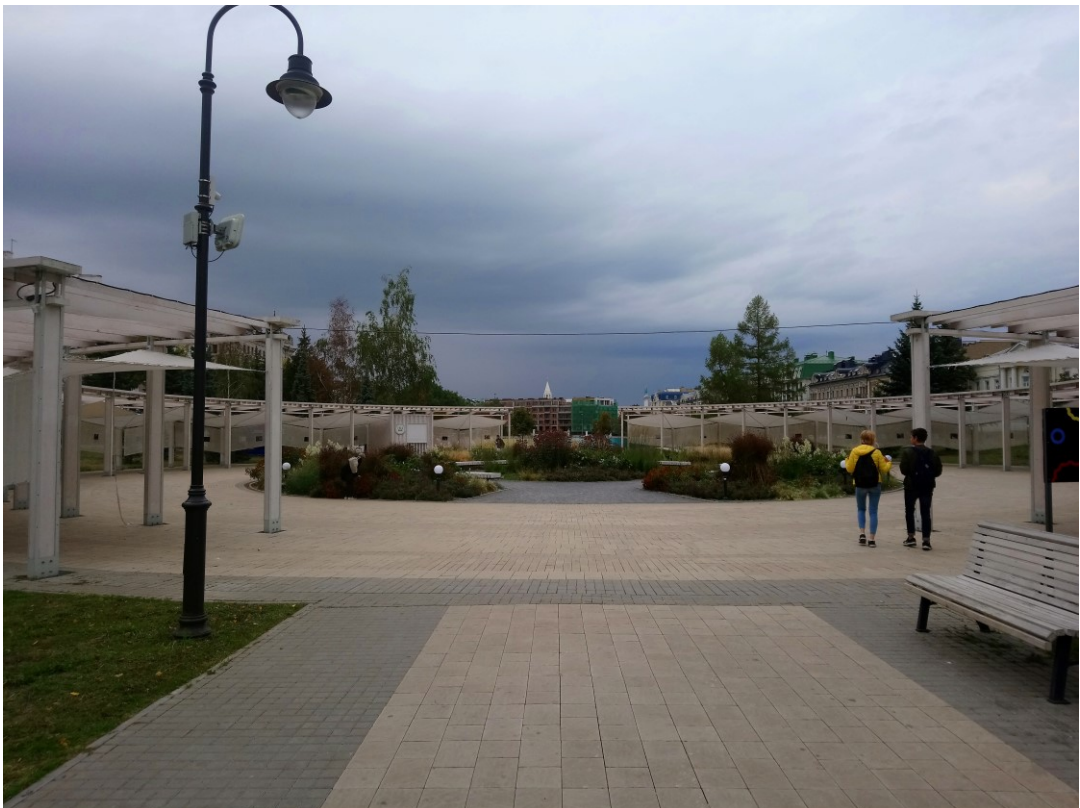
Фото 8. Центральная аллея.