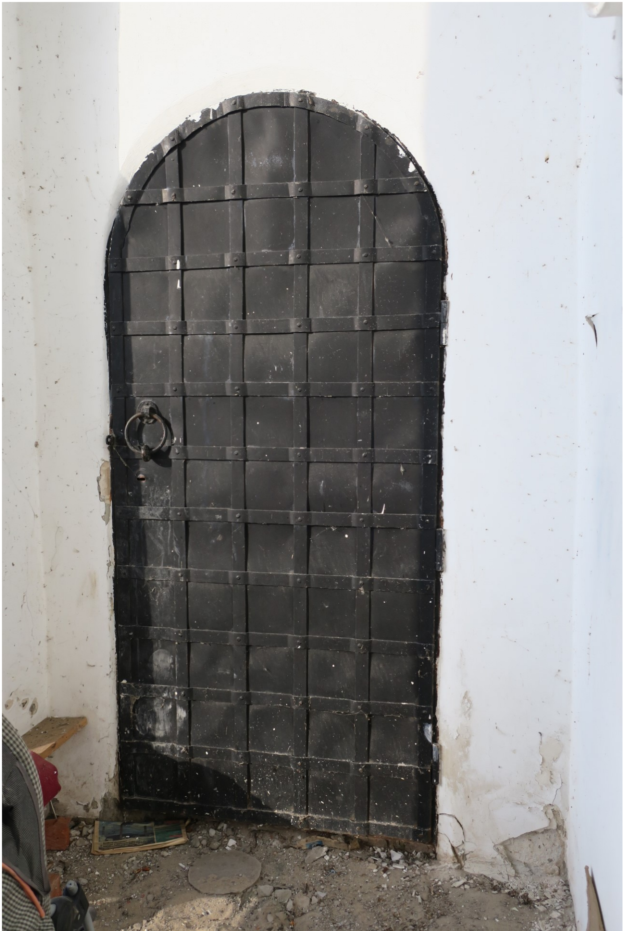
Фото 22. Входная дверь.