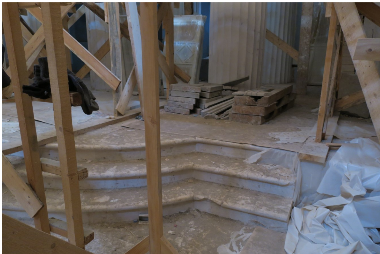
Фото 9. Ступени в помещении верхнего храма