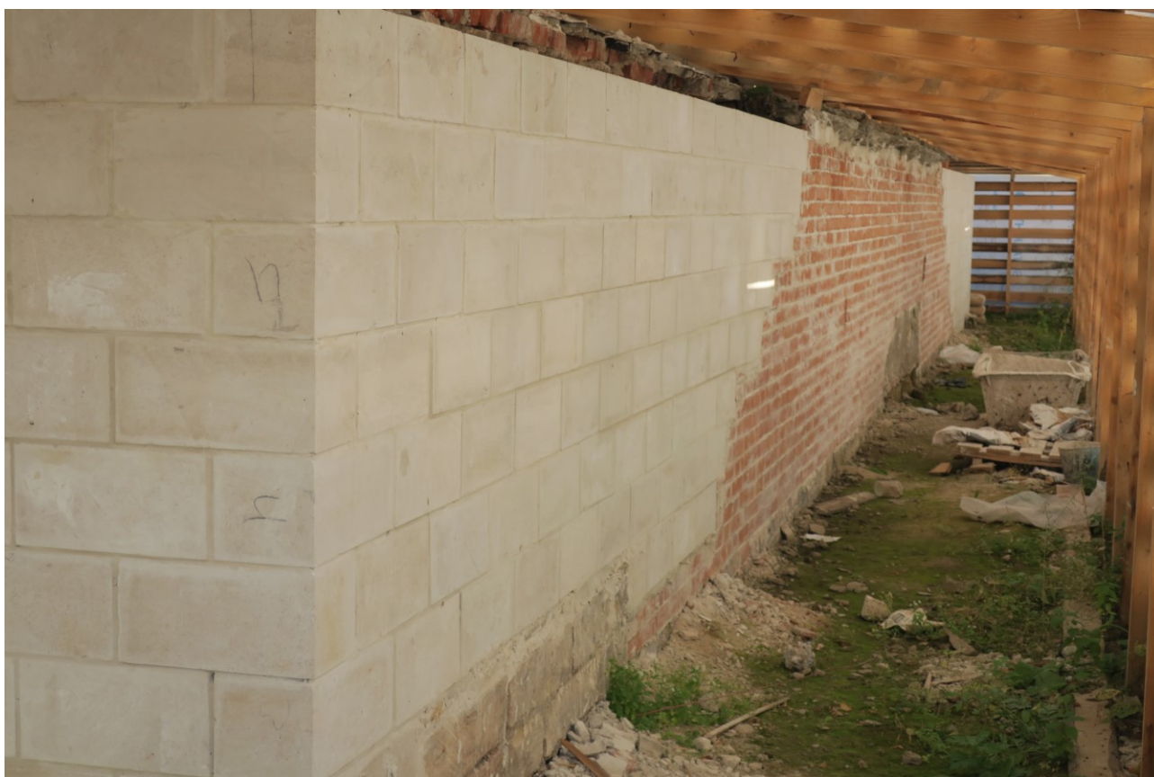
Фото 6. Фрагмент цокольной части.