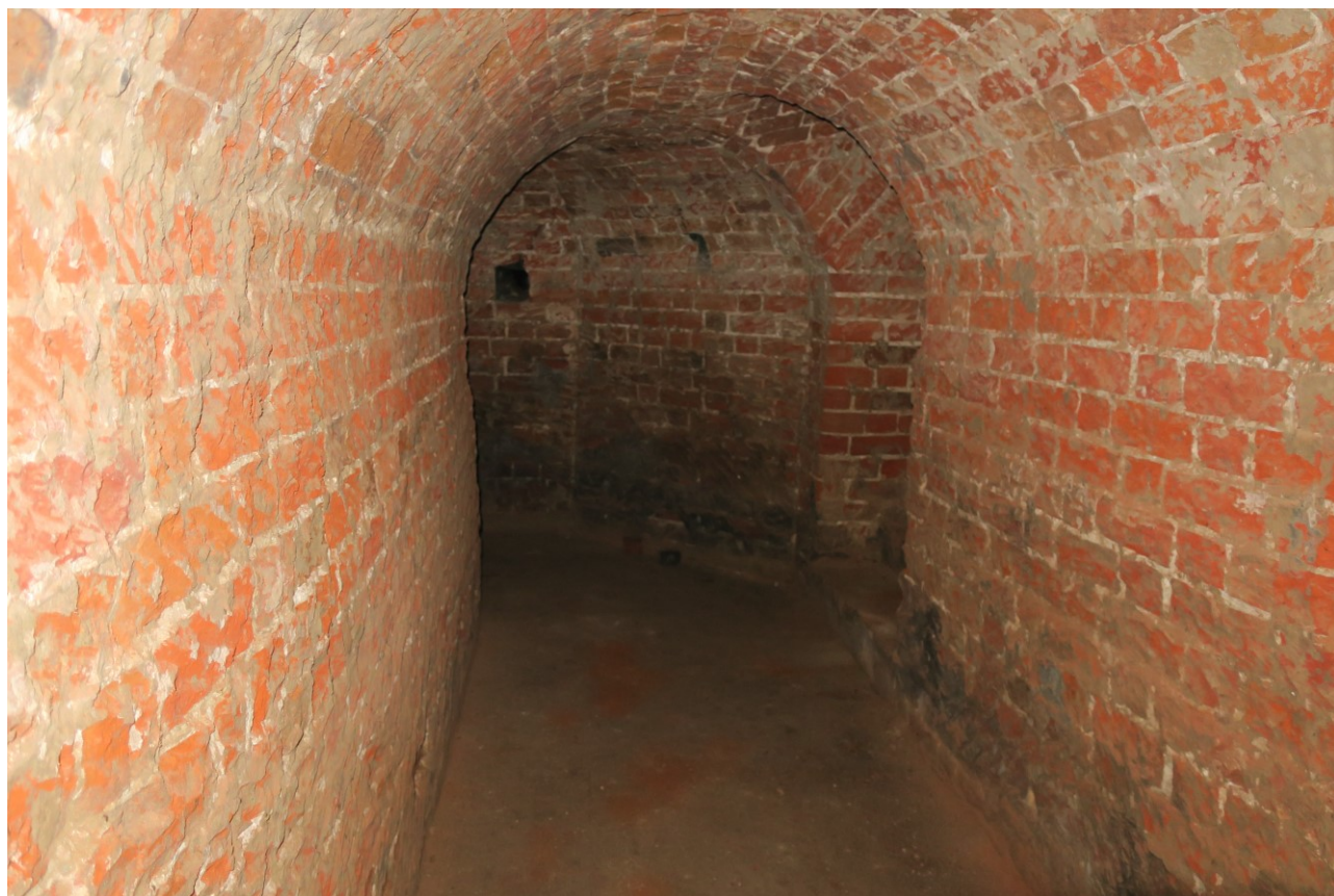
Фото 17. Коридор в нижних помещениях.