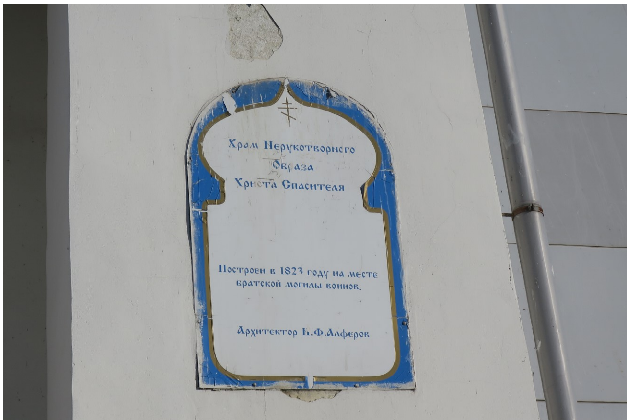
Фото 3. Информационная надпись на западном фасаде.