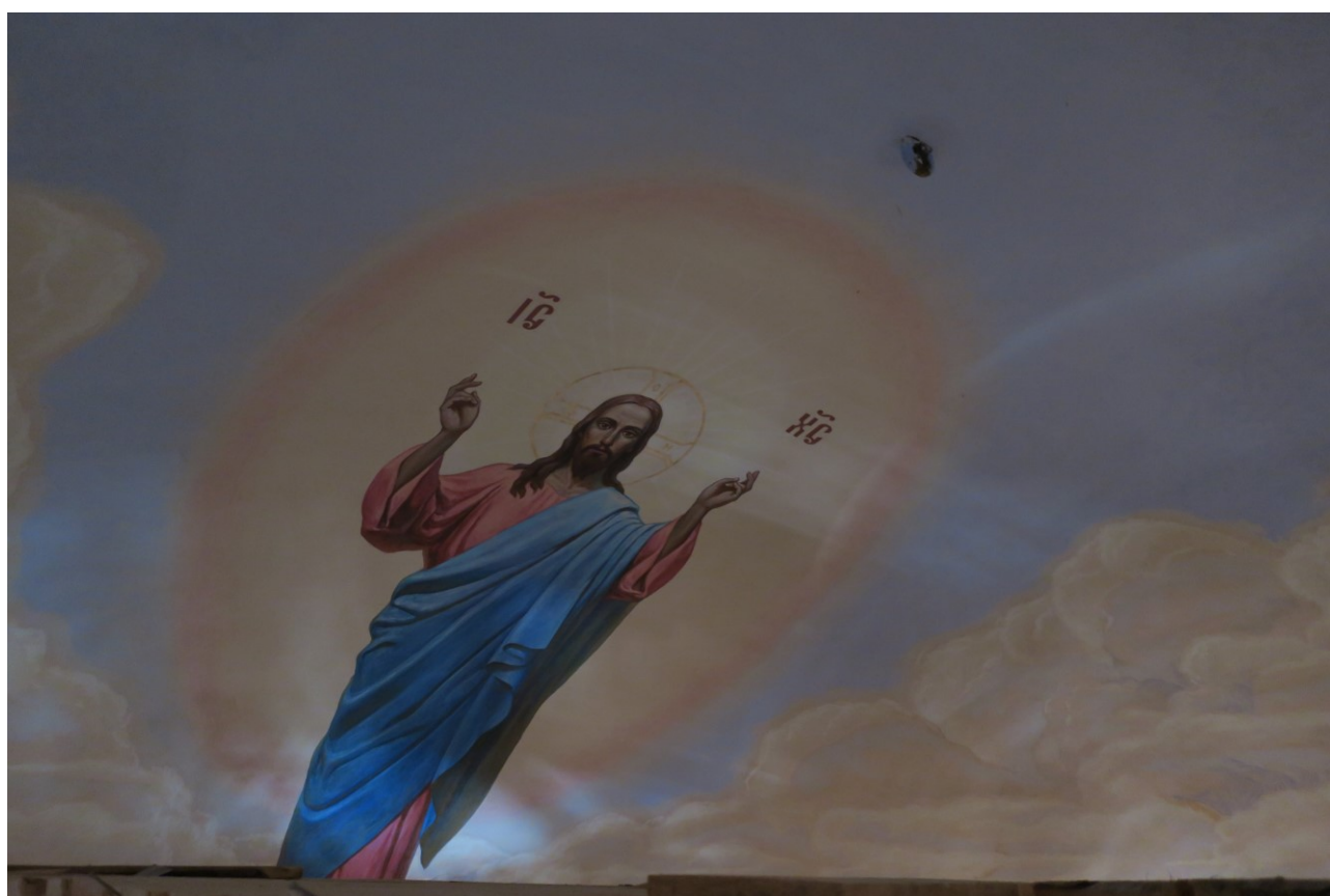
Фото 14. Фрагмент росписей купола верхнего храма.