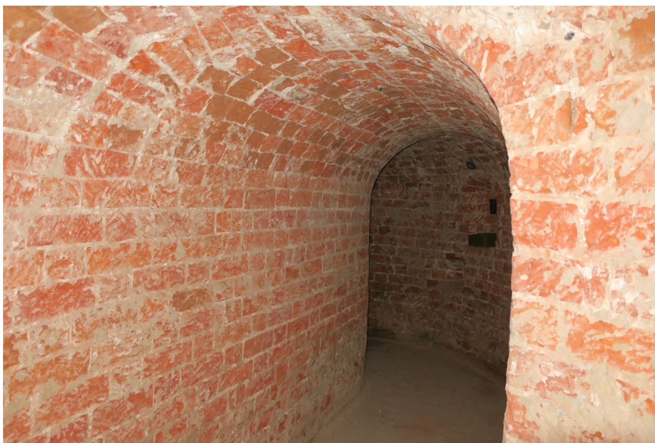
Фото 16. Коридор в нижних помещениях.