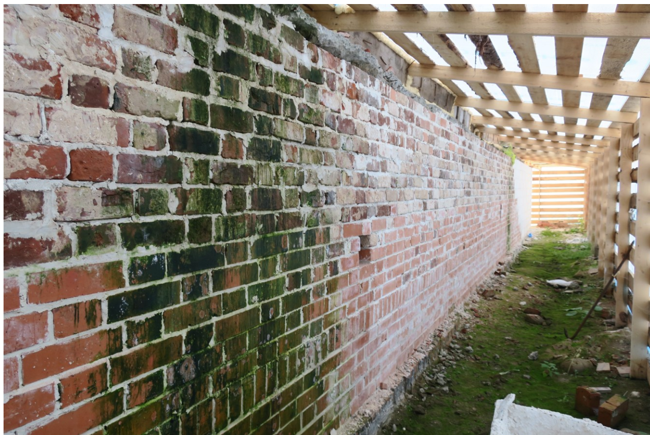
Фото 7. Фрагмент кладки цокольной части.