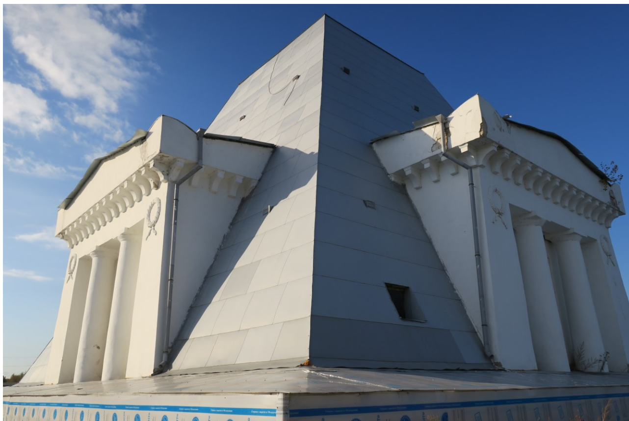
Фото 5. Южный и восточный фасады.