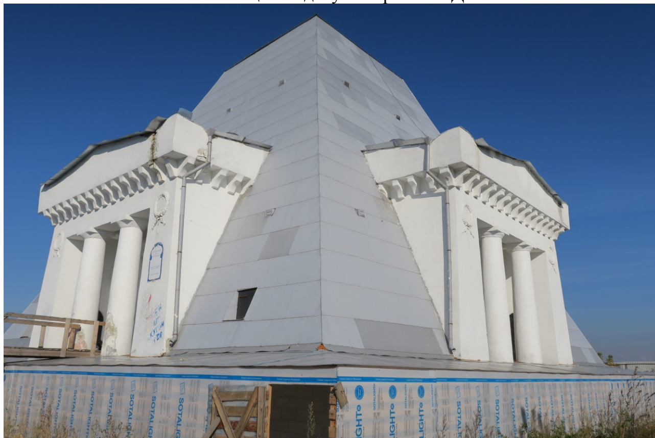
Фото 2. Западный и южный фасады.