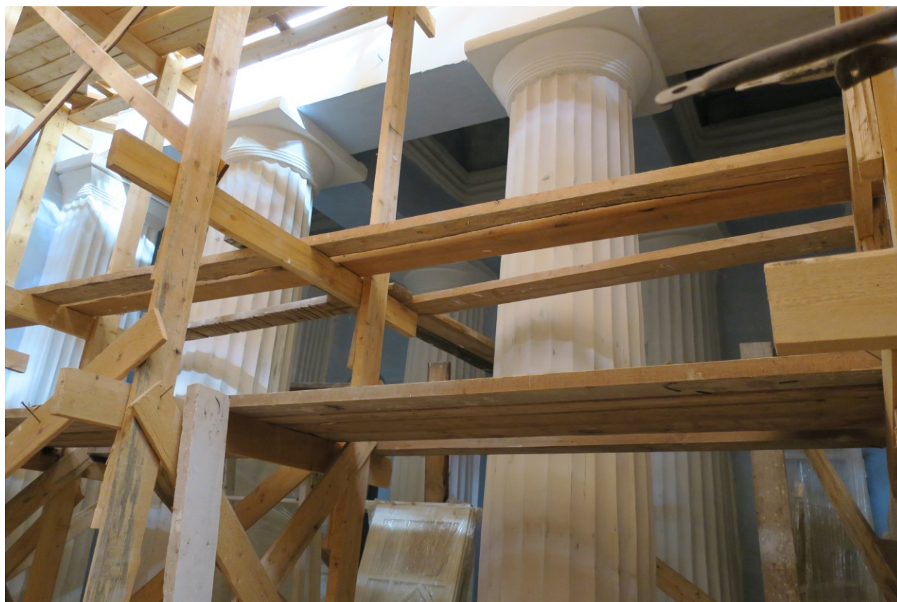
Фото 8. Колонны в верхнем храме