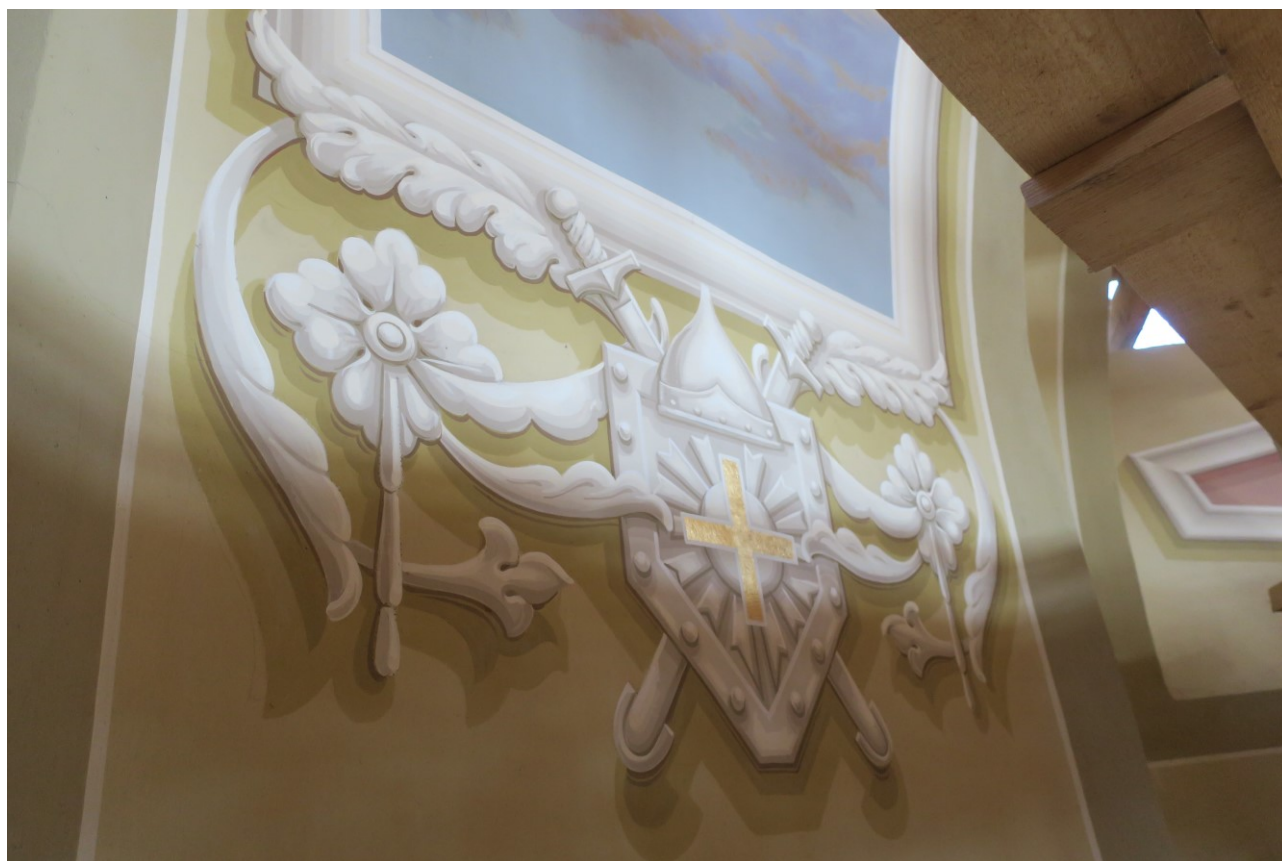
Фото 12. Росписи на стенах верхнего храма.