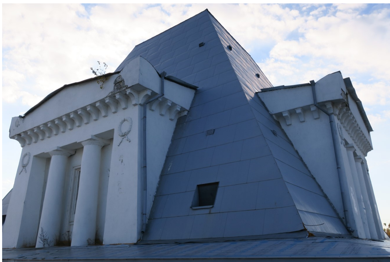
Фото 4. Северный и восточный фасады.