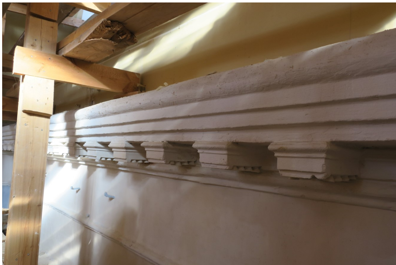
Фото 11. Фрагмент карниза под сводом верхнего храма