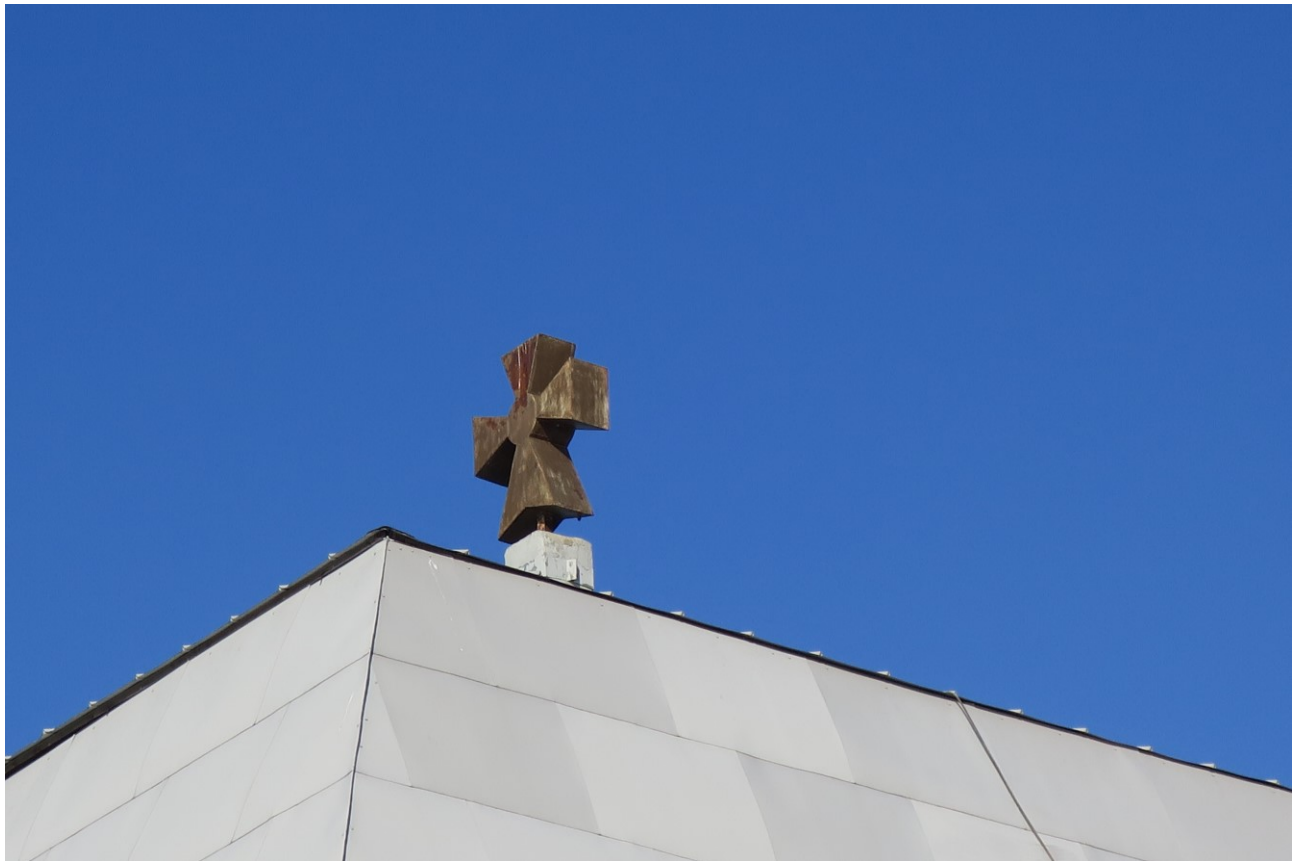
Фото 24. Крест в завершении храма.