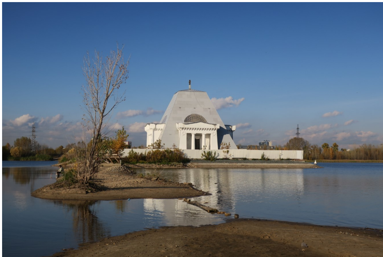
Фото 1. Общий вид с ул. Кировская Дамба.