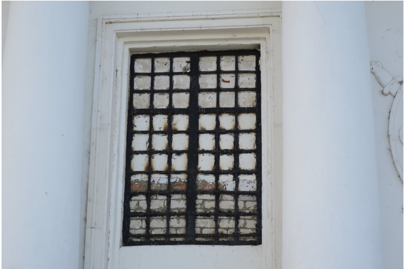
Фото 23. Заложенный оконный проем.