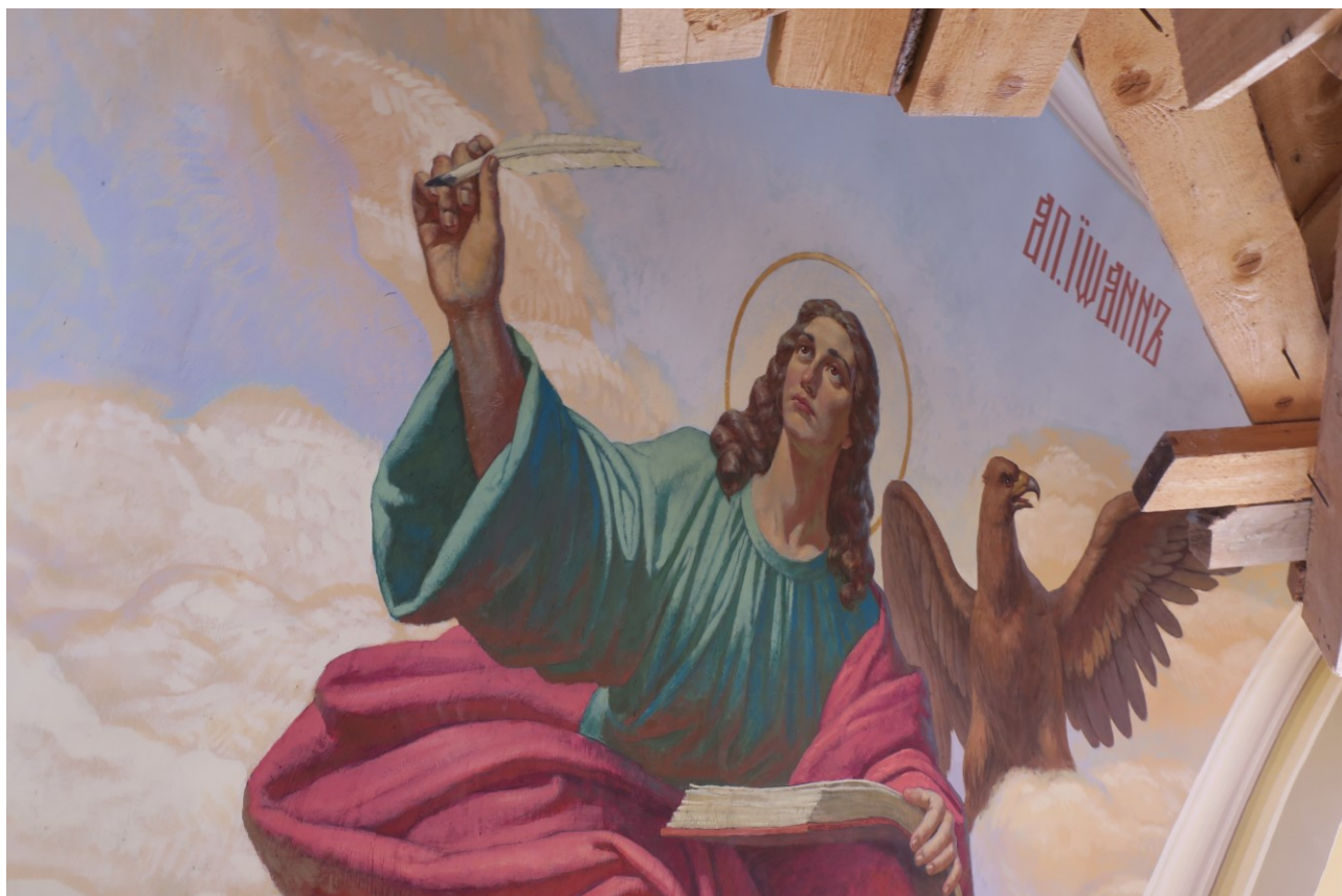
Фото 13. Фрагмент росписей купола верхнего храма.