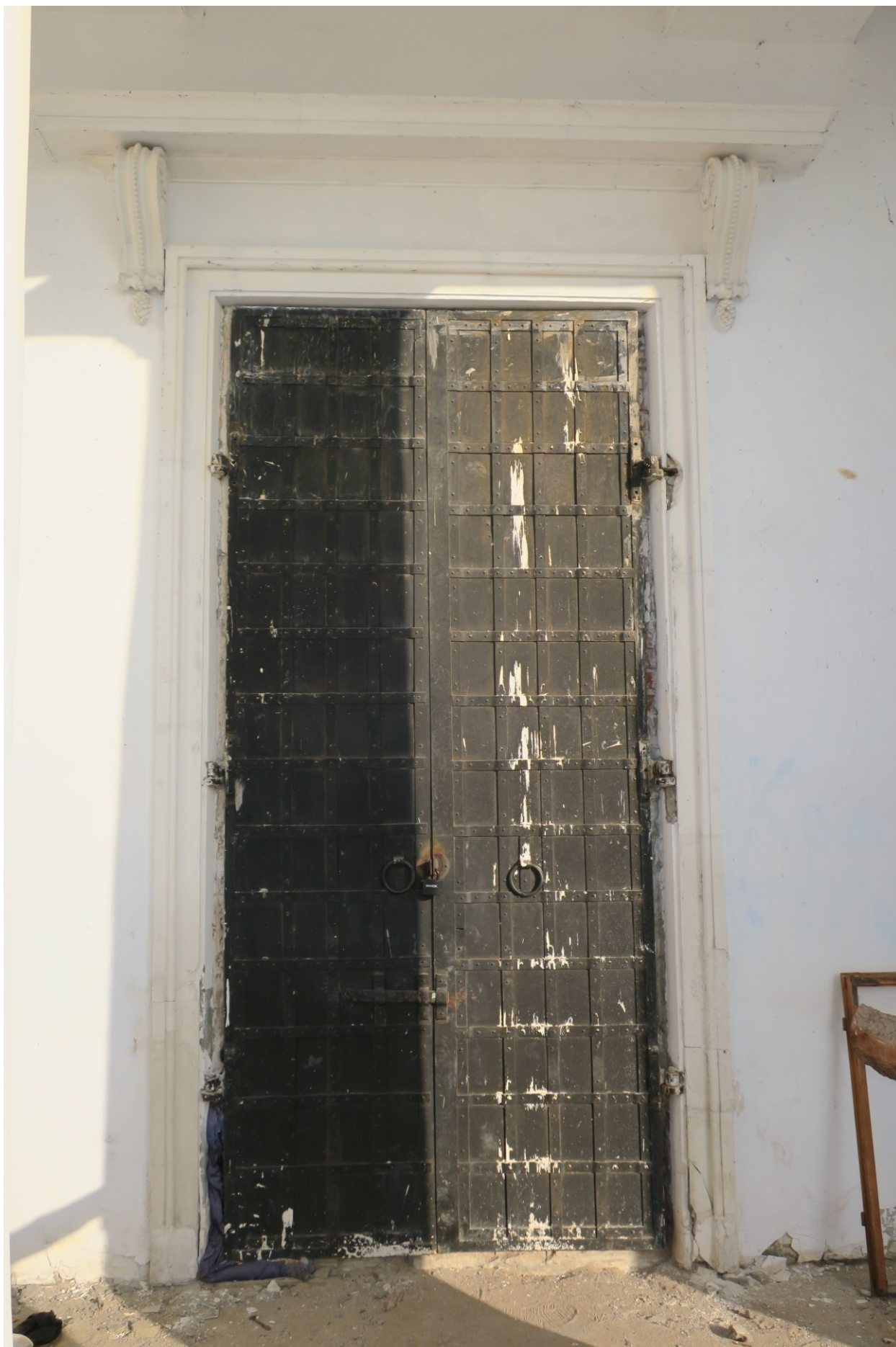
Фото 21. Входная дверь.