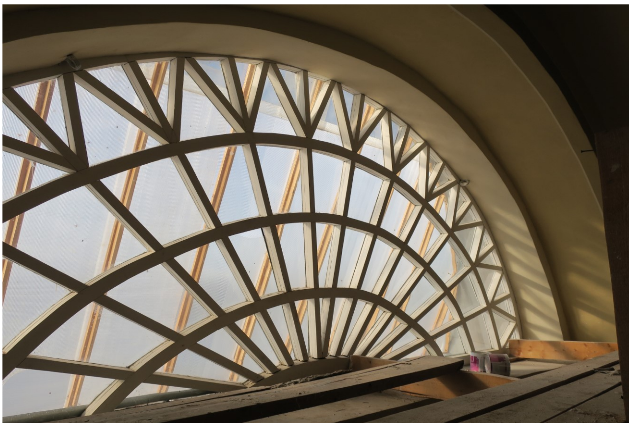
Фото 10. Оконный проем в верхнем храме