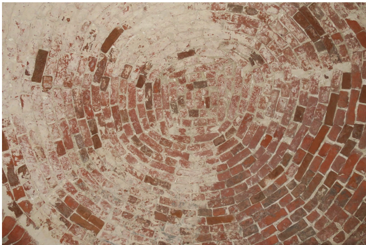
Фото 19. Сводчатое перекрытие кельи.