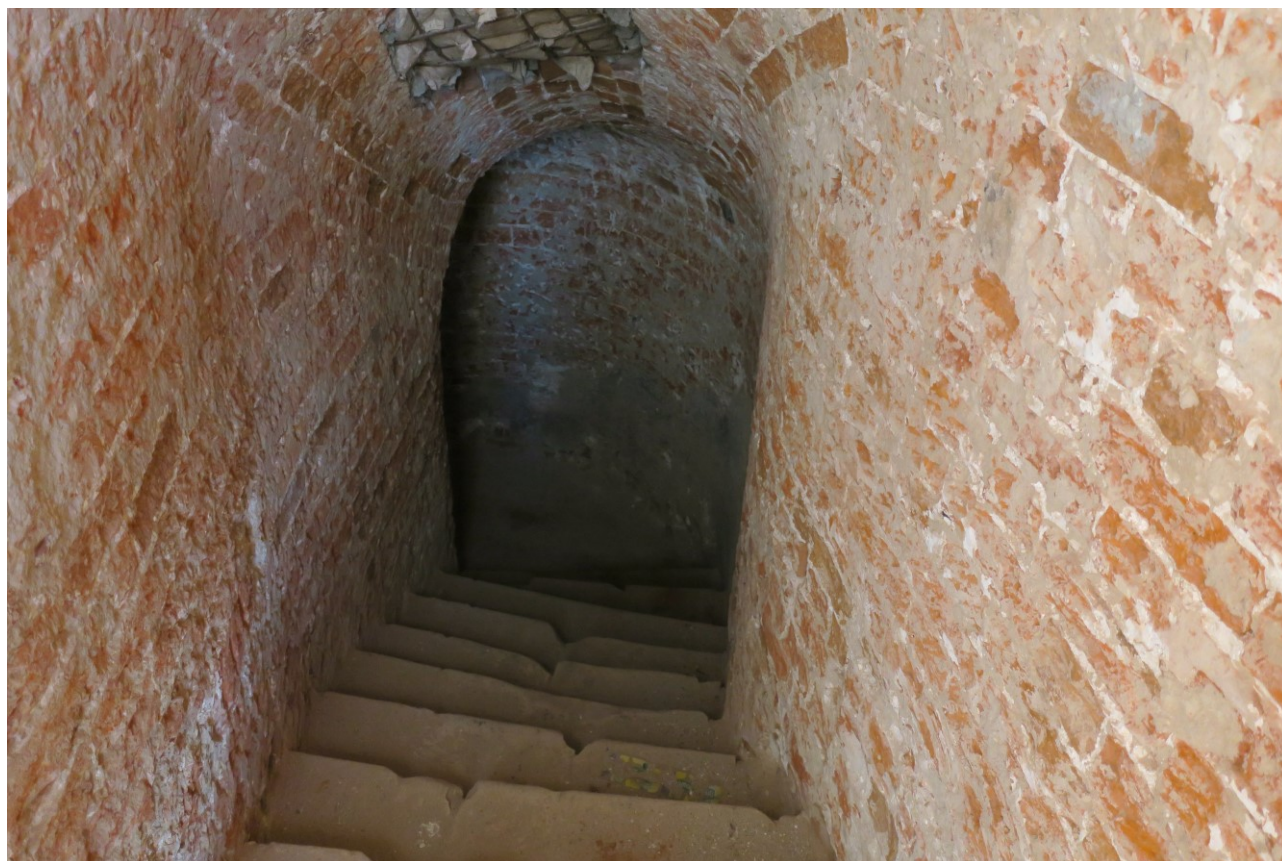
Фото 15. Ступени в склеп.