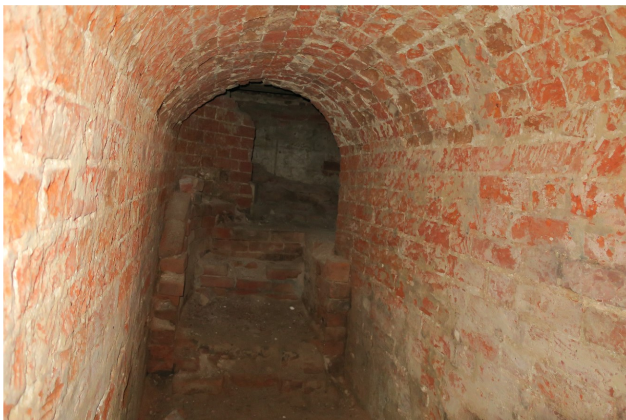
Фото 18. Коридор в нижних помещениях.